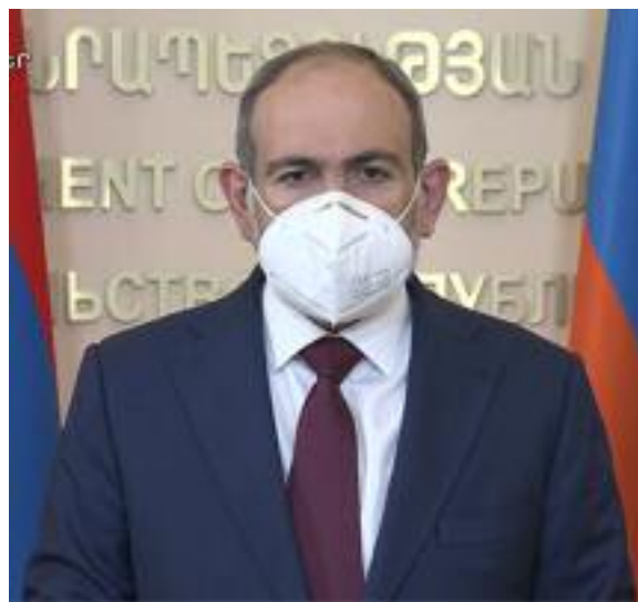
Primer ministro Nikol Pashinian

“Muchos países del mundo tienen agencias para impulsar las exportaciones y atraer inversiones extranjeras. Armenia necesita una agencia que trabaje en ambas