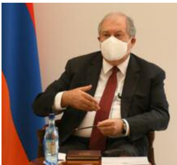
Presidente Armén Sarkisian

Más tarde, el mandatario y su esposa visitaron el pueblo de Nor Shen (Jarkov),