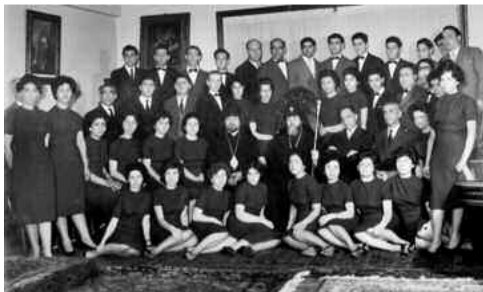
Con S.S. Vazkén I, en su primera visita pontifical a la Argentina y el entonces legado catolicosal de la Iglesia Apostólica Armenia para América del Sur, arzobispo Papkén Abadian, en el Arzobispado.

Hoy, en este reconocimiento como "Grupo del Año de la Colectividades Armenias de Sudamérica" queremos honrarlos a todos ellos, junto a sus directores, Levón