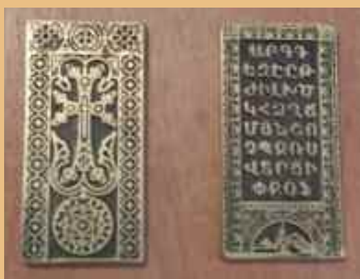
Manuel Gheridian Obsequios en bronce. Obras pictóricas.