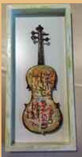
Gladys Apkarian Pequeño y gran formato