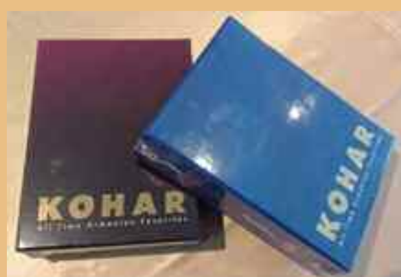
KOHAR. Colecciones DVD de la gira sudamericana y del Centenario.