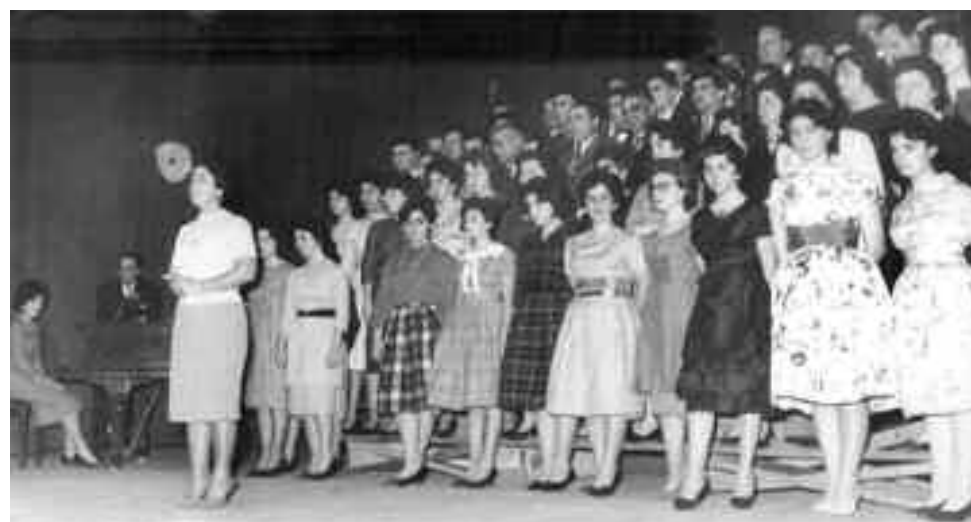
Actuación del coro en el salón del Centro Armenio en 1958.

Hoy, a noventa años de su creación, el Gomidás sigue firme como siempre. ¡Salud y gracias, amigos! ¡Por muchos años más de servicio a la armenidad!