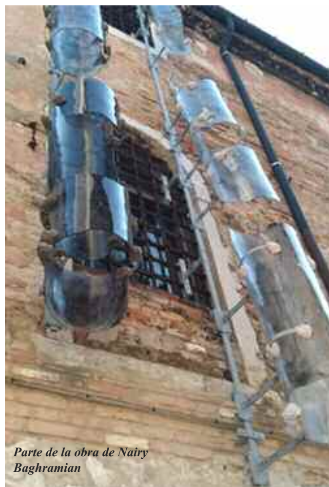
Parte de la obra de Nairy Baghramian