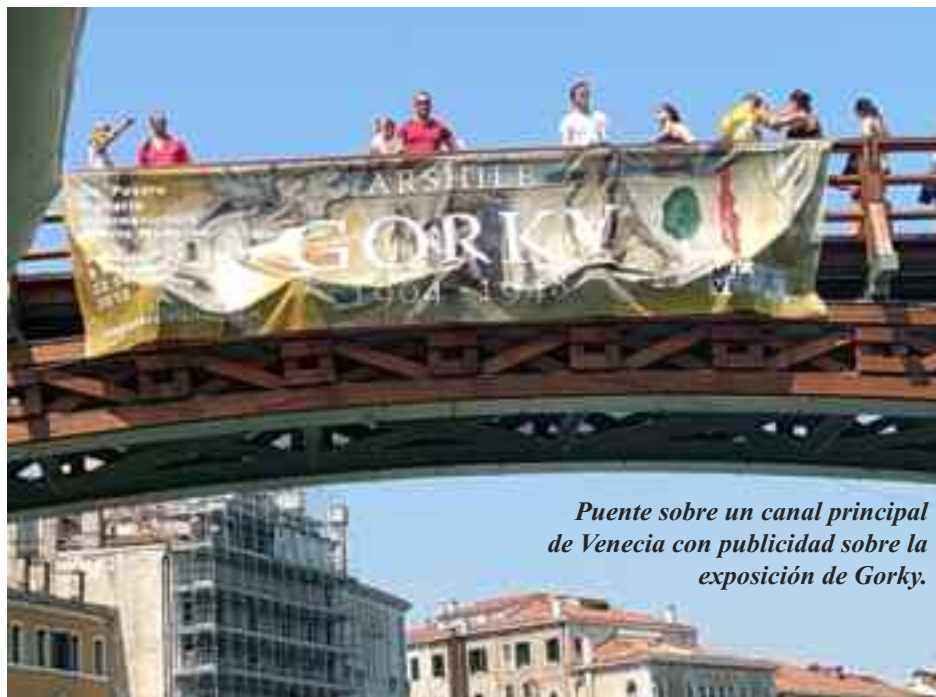
Puente sobre un canal principal de Venecia con publicidad sobre la exposición de Gorky.

El segundo caso es el de Azar Mah- verdaderos avances en materia de arte y la convicción de que las frustraciones de las generaciones pasadas son las mismas que las actuales. Cita explícita-