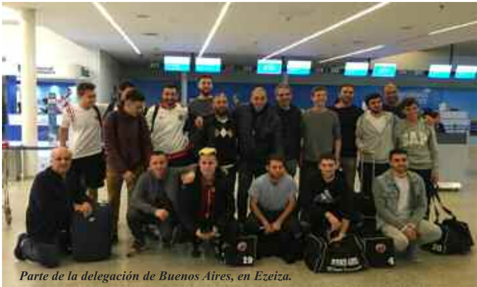
Parte de la delegación de Buenos Aires, en Ezeiza.

El lunes, el primer ministro de Armenia, Nikol Pashinian, quien se encontraba en Stepanakert, mantuvo una reunión con