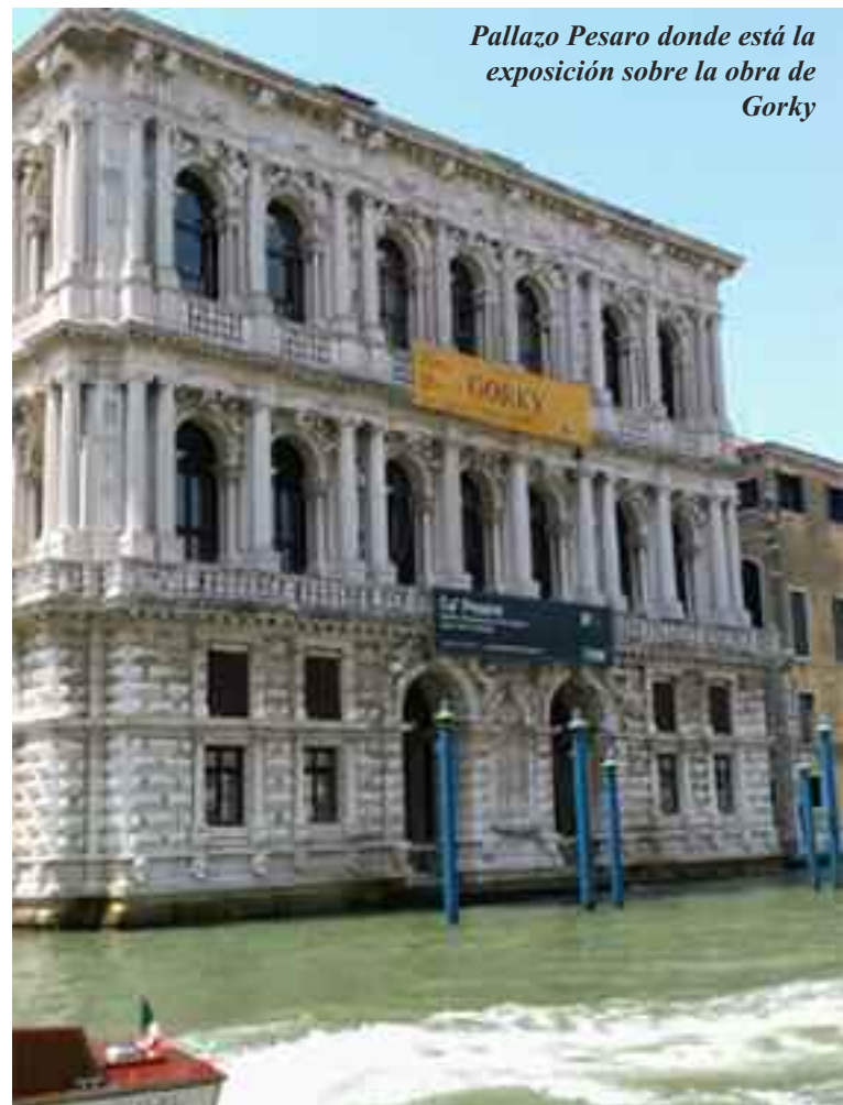
Palazzo Pesaro donde está la exposición sobre la obra de Gorky

mente los siguientes períodos históricos de Irán: 2009: Revolución verde; 1979: La revolución iraní; 1953: Golpe de la CIA en Irán; 1905-1911: Revolución constitucional persa.