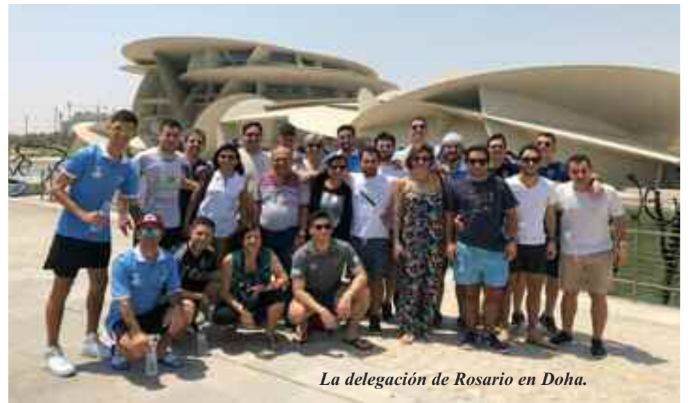
La delegación de Rosario en Doha.