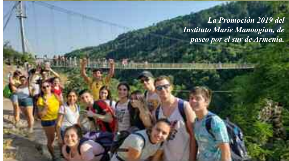
La Promoción 2019 del Instituto Marie Manoogian, de paseo por el sur de Armenia.