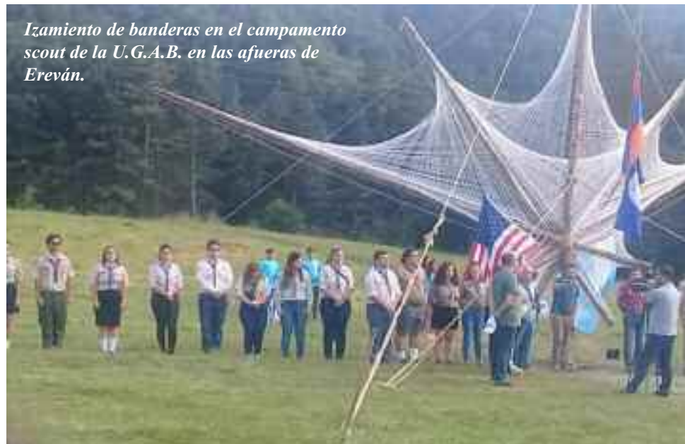
Izamiento de banderas en el campamento scout de la U.G.A.B. en las afueras de Ereván.

Mientras tanto, los apreciamos en estas fotos.