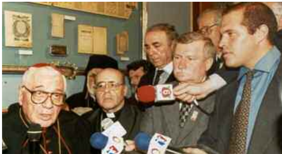
Antonio Quarracino junto a Lech Walesa en la Inauguración del Mural, en 1997

Buenos Aires, 18 de julio de 2019, (Infobae). - Se trató del ataque terrorista más letal en la historia de Argentina, con un número de víctimas aún mayor que en el ataque a la embajada de Israel perpetrado dos años antes.