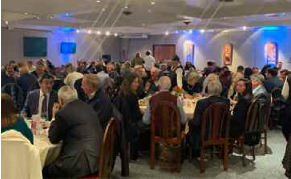
Vista parcial del salón Sahaguian.