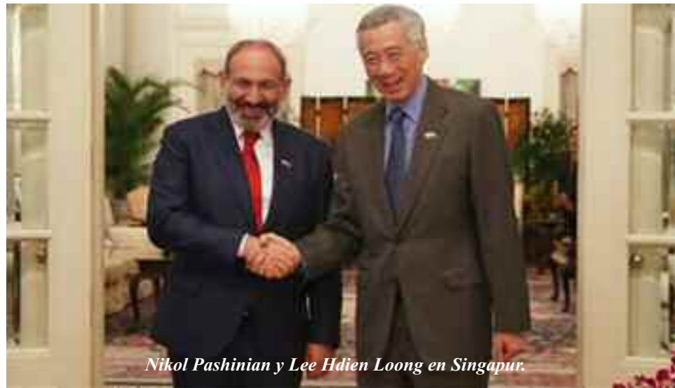
Nikol Pashinian y Lee Hsien Loong en Singapur.

En la reunión se trataron temas relativos a la promoción de los lazos comerciales y económicos, cooperación en tecnologías de la información, laboratorios e ingeniería, turismo, cuidado de la salud, educación, ciencias y protección ambiental. En cuanto a los lazos comerciales, se acordó realizar un Foro de Negocios en el marco de la reunión de la Comisión Intergubernamental, que tendrá lugar en Ereván en los próximos meses. Se analizaron programas de inversión conjunta y las posibilidades de exportar brandy y vino armenio al mercado