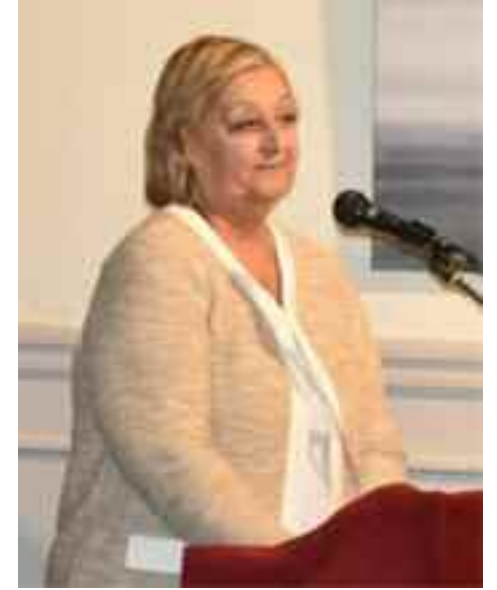
Habla la ministra Liliam Kechichian.