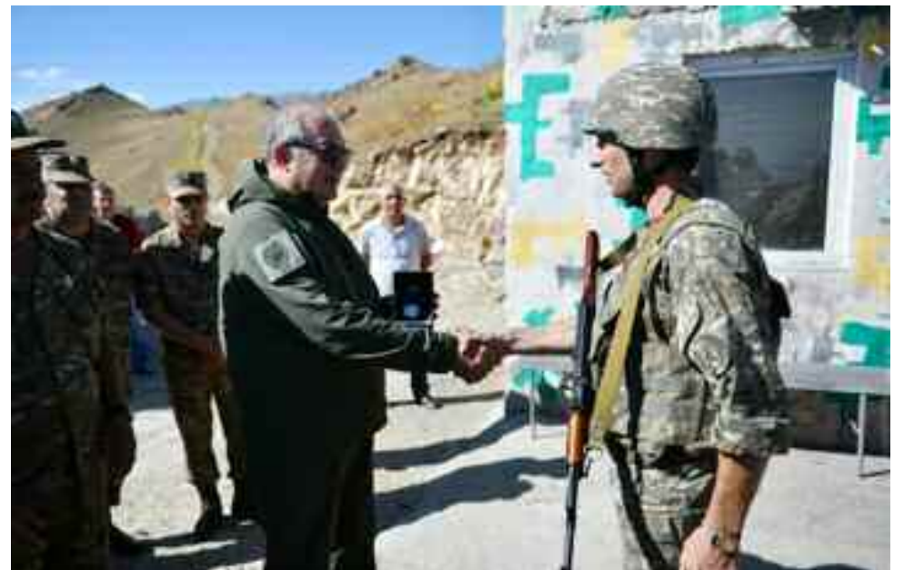
El presidente Armén Sarkisian entrega reconocimientos a soldados destacados en su servicio de protección de las fronteras en Siunik.

"El pueblo armenio: reconociendo como base los principios fundamentales del Estado armenio y las aspiraciones nacionales consagradas en la Declaración sobre la Independencia de Armenia, des-