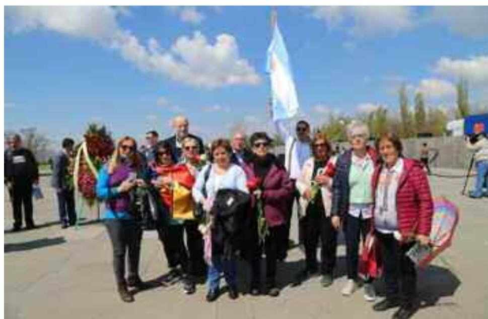
24 de abril. Marchando a Dzidzernagapert para rendir homenaje al millón y medio de Santos Mártires del genocidio armenio.