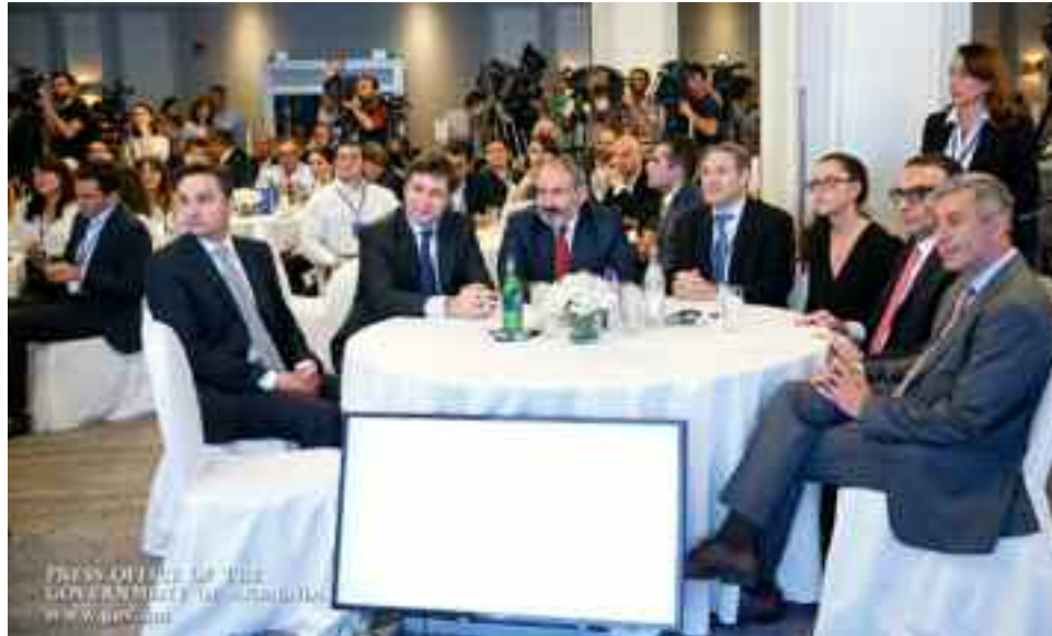
El primer ministro Nikol Pashinian, con directores y ejecutivos de Corporación América en la Convención.

Haciendo hincapié en la importancia estratégica del transporte aéreo para la República de Armenia, debido a la situación de semi-bloqueo desde los primeros días de su independencia, el primer ministro sostuvo que se está trabajando de manera conjunta en una agenda adicional, gracias a la cual se pasará a explotar el aeropuerto de Gujumri lo antes posible. "Esto a su vez, ayudará a resolver otro problema importante: los precios más bajos para los pasajeros de avión, lo cual es muy importante para el desarrollo del turismo" -dijo el primer ministro.