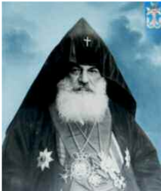
Katolikós Kevork V Surenian

Ante un inminente desastre, una delegación de notables se dirigió a Echmiadzín, la Santa Sede de la Iglesia Armenia, para proponer al katolikós Kevork V Surenián, trasladarlo a un lugar más seguro. El katolikós, como autoridad suprema de la Iglesia Armenia se negó a ser evacuado y contestó airado: "Si la nación armenia y sus solda-