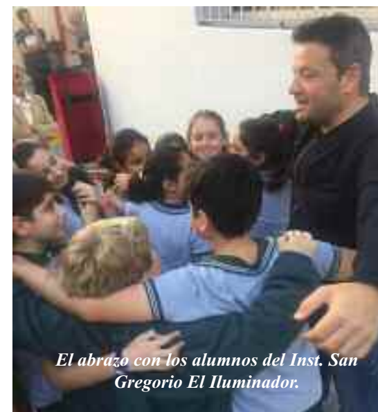
El abrazo con los alumnos del Inst. San Gregorio El Iluminador.