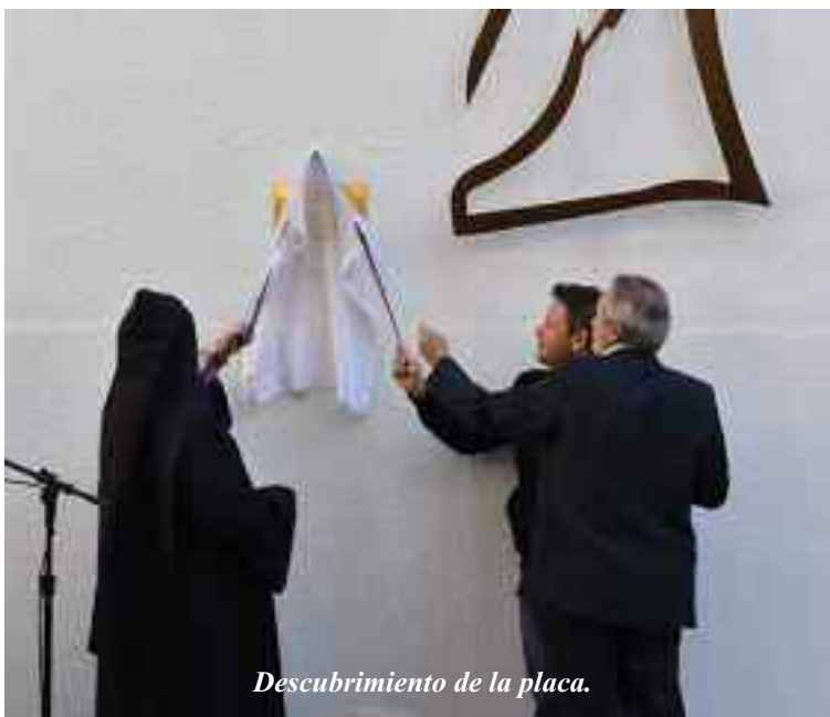
Descubrimiento de la placa.

Aun más, “El Abrazo” ha sido emplazado en varias ciudades del exterior de nuestro país. Una de las más visibles y famosas es la del aeropuerto Fumicino de Roma.