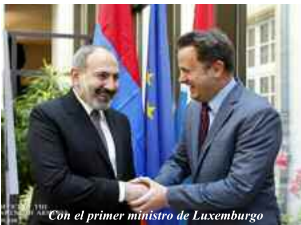
Con el primer ministro de Luxemburgo