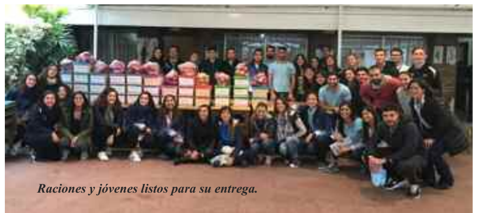
Raciones y jóvenes listos para su entrega.