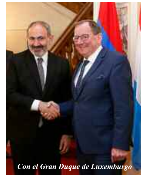
Con el Gran Duque de Luxemburgo

En ese sentido, Pashinian agradeció la posición balanceada de Luxemburgo con respecto al conflicto de Karabaj y al reconocimiento del genocidio armenio.