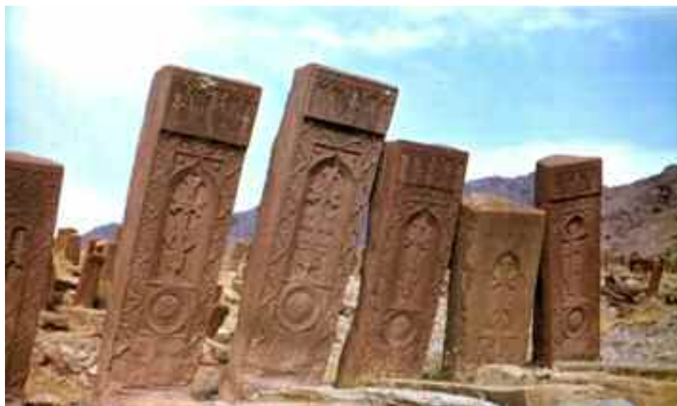
Algunos de los miles de jachkars de Djulfa (siglo XVI) fotografiados en la década de 1970, antes de su destrucción