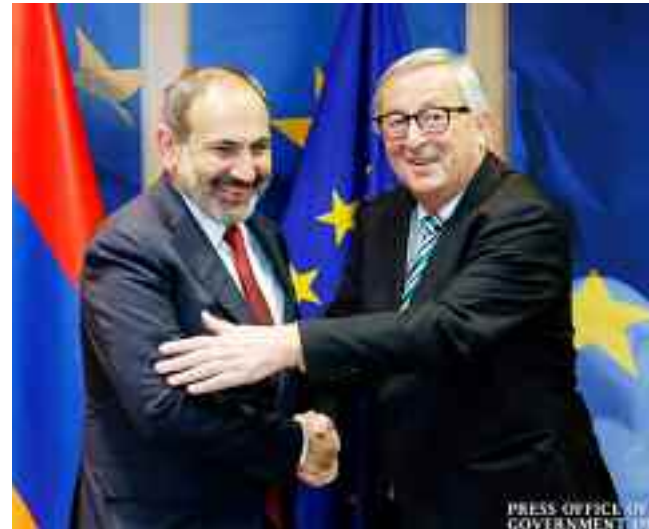
El primer ministro Nikol Pashinian, Con Donald Tusk (izq.) y Jean Claude Juncker (der.).

Con referencia al Acuerdo de Asociación Integral y Mejorada, ambas partes destacaron el trabajo en curso para su ratificación.