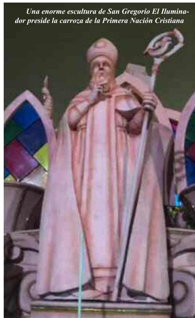
Una enorme escultura de San Gregorio El Iluminador preside la carroza de la Primera Nación Cristiana