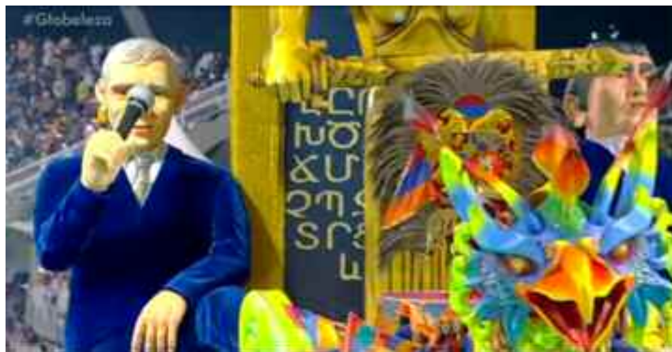
Carroza dedicada a la cultura y el arte armenio. Bajo la escultura de "Mair Hairenik", el alfabeto armenio y a su derecha, la imagen de Charles Aznavour.