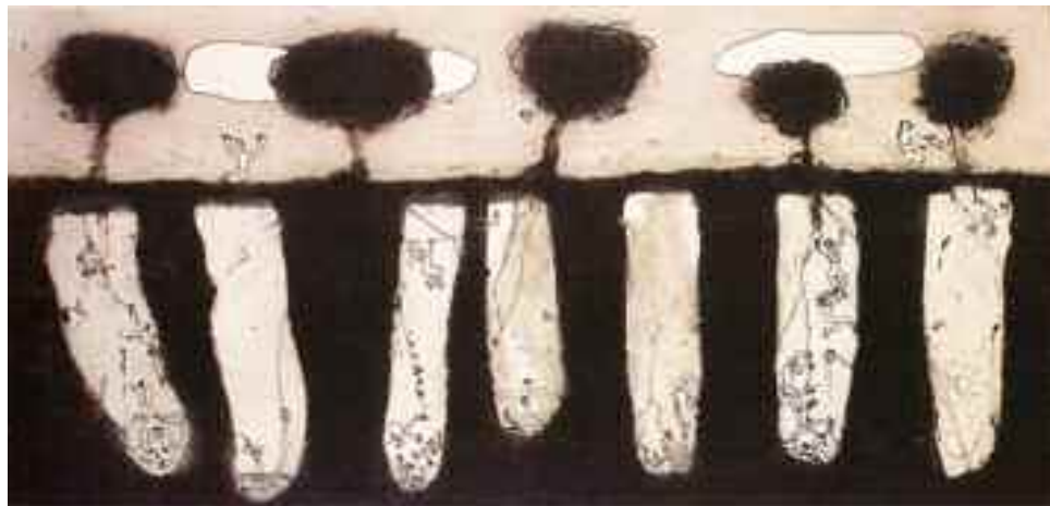
Ignacio Iturría, "El pasado siempre vivo", Museo Nacional de Bellas Artes.

Según su sitio, la agencia de crédito a la exportación danesa desplegó todos los esfuerzos para respetar "las normas y los principios fundamentales" que enmarcan la