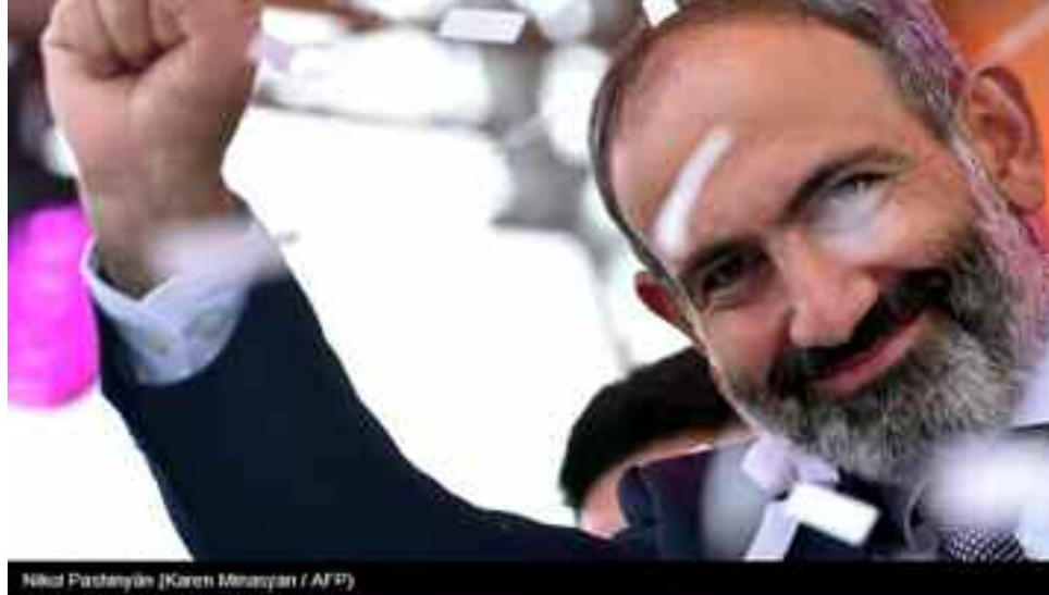
Nikol Pashinyan

Sí lo sabe. Él mismo entró en el juego luciendo siempre una gorra, regalada por un diseñador, con el lema "Con coraje" , que es lo que dijo un día a alguien que hacía sonar el cláxon de su coche en una protesta. La camiseta militar de camuflaje que solía llevar era otro mensaje, muy importante en este país diminuto que vive en estado de guerra latente con Azerbaiyán –por la ocupación armenia del enclave de Nagorno Karabaj hace dos decenios–, que tiene la