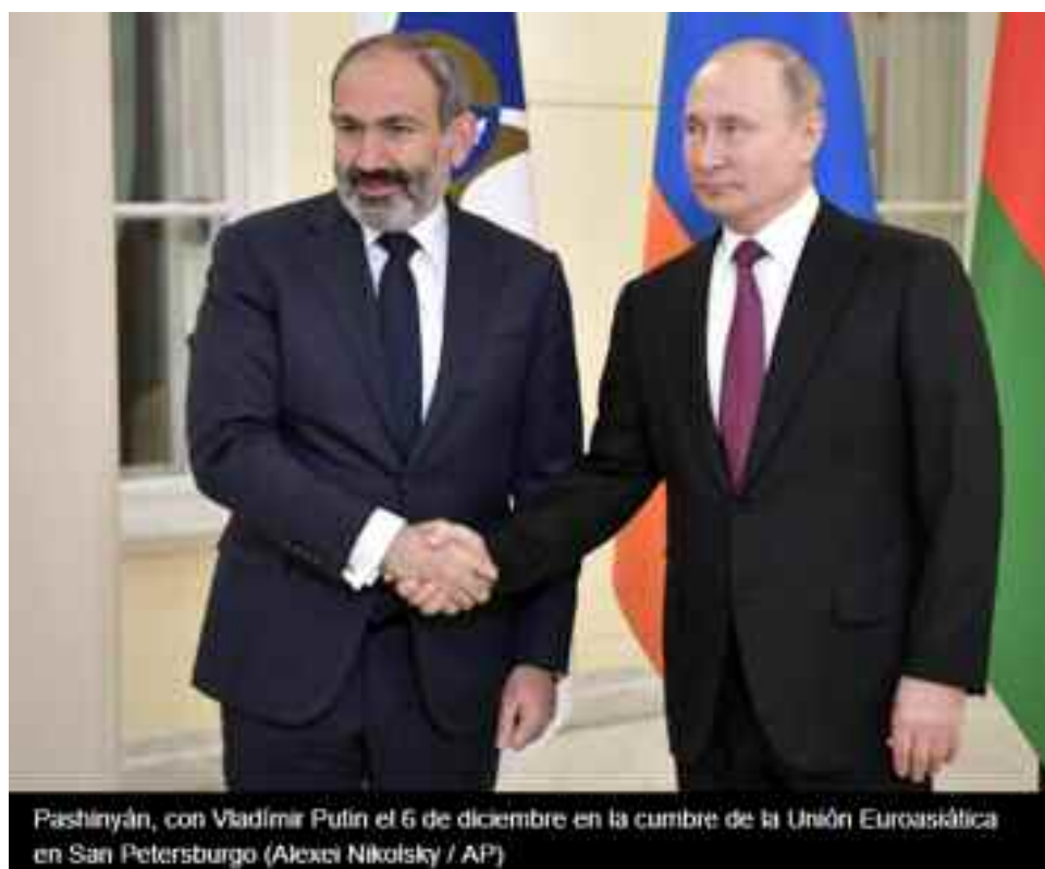
Pashinián, con Vladimir Putin el 6 de diciembre en la cumbre de la Unión Euroasiática en San Petersburgo

Los republicanos han recibido un golpe muy duro, y el poder que aún mantienen en el ámbito rural podría desintegrarse. Hasta la primavera no harán un congreso para reconstituirse. Quizá será tarde para entonces porque Nikol Pashinián y los suyos les tomaron la delantera.