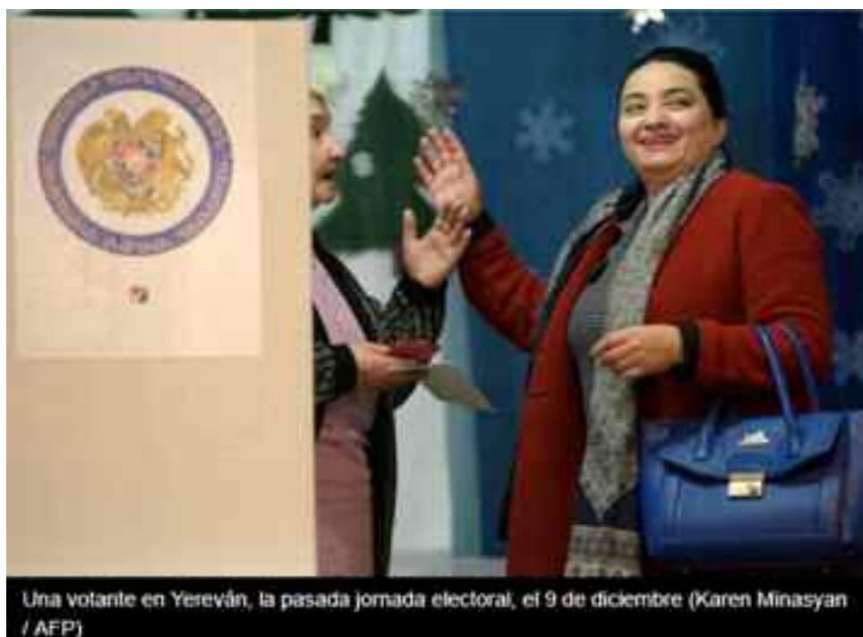
Una votante en Yereván, la pasada jornada electoral, el 9 de diciembre