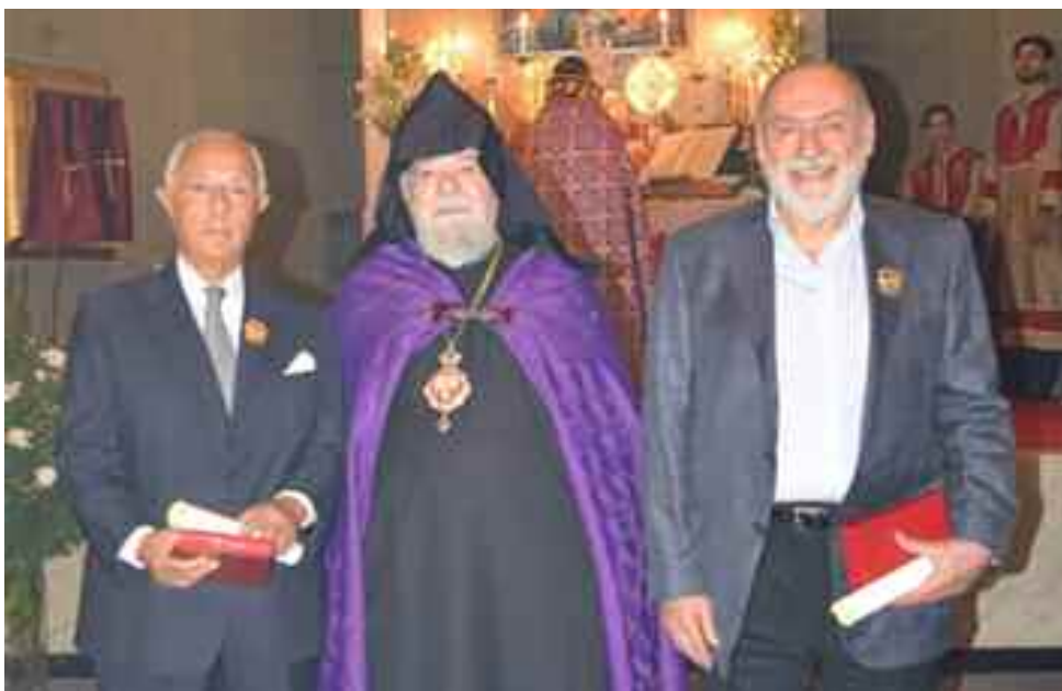
Las personalidades distinguidas junto al primado de la Iglesia Apostólica Armenia para la Argentina y Chile, arzobispo Kissag Mouradian. (Ver página 3)