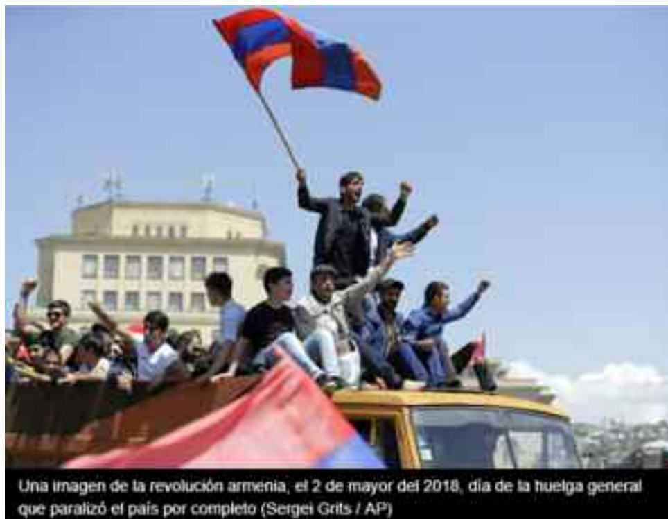
Una imagen de la revolución armenia, el 2 de mayo del 2018, día de la huelga general que paralizó el país por completo