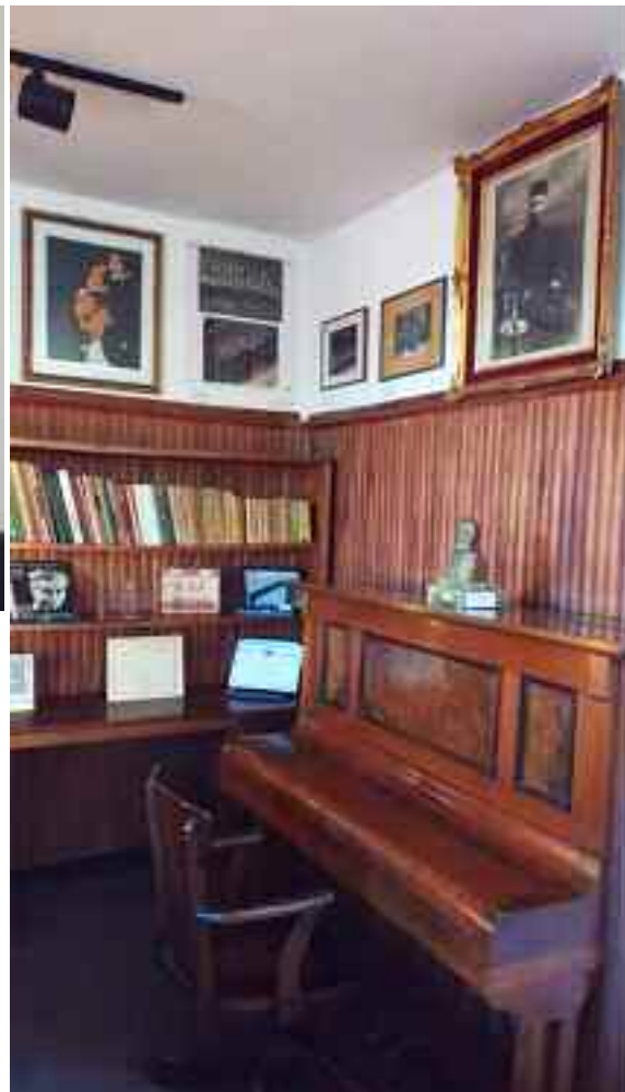
El rincón del piano, con la imagen del Padre Gomidás, fotos, plaquetas, libros, partituras, las gradas y pupitres. Abajo, el maestro, con algunas de las coreutas.

Un hermoso espacio, lleno de recuerdos, que vale la pena recorrer.