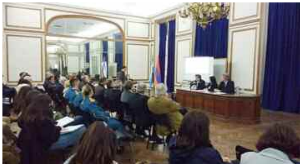
Vista parcial del público presente en la Universidad.