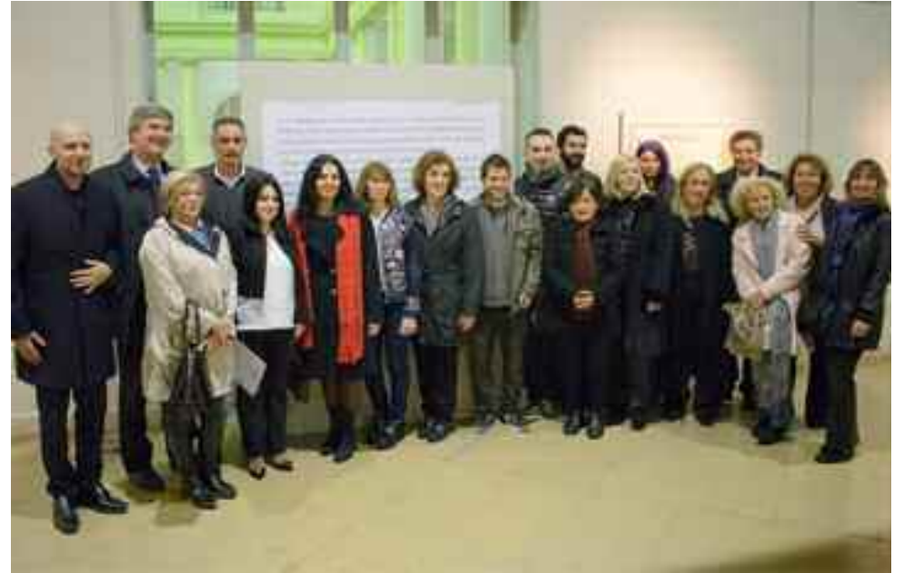
La embajadora de Armenia con artistas y responsables de la organización y puesta de la muestra “Los IAN: un recorrido por la identidad armenia”.

tema educativo y de salud se perfecciona, la libertad de mercado va dando frutos con participación de empresas extranjeras y capitales armenios de la diáspora, las mejoras de la infraestructura se hacen con participación de connacionales de todo el mundo, y el país va pasando a la responsabilidad de una generación que ya ronda los treinta años de edad y que prácticamente no tiene