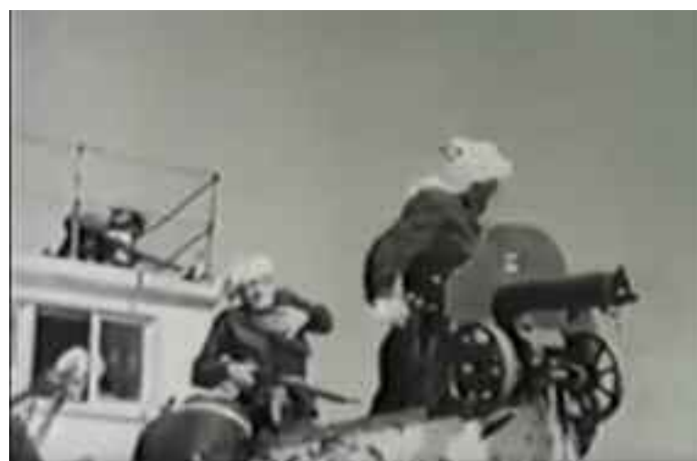
La nave "Ashot Erkat" aparece en la película "Los pescadores del lago Seván" del año 1938. Este buque de guerra tenía dos cañones ligeros y cincuenta marineros.