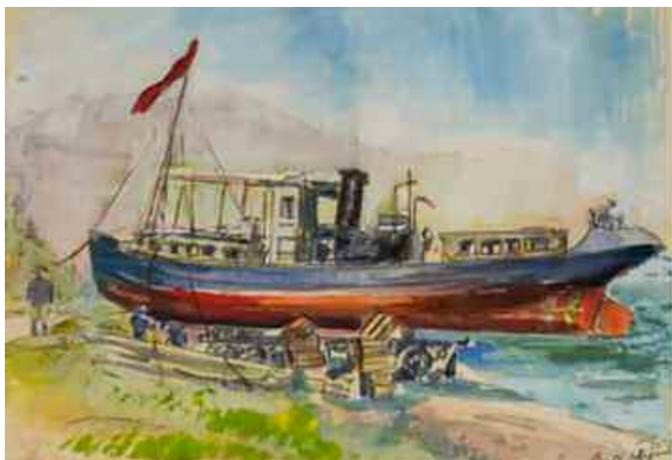
"El barco Lukashin en el Seván". Acuarela de Vera Vart-Badriguián (1930). Pinacoteca Nacional de Armenia.

FE DE ERRATAS: En nuestra edición anterior, el título de la nota publicada en esta sección debe leerse: "La fuerza aérea de la República de Armenia se creó en 1918" .