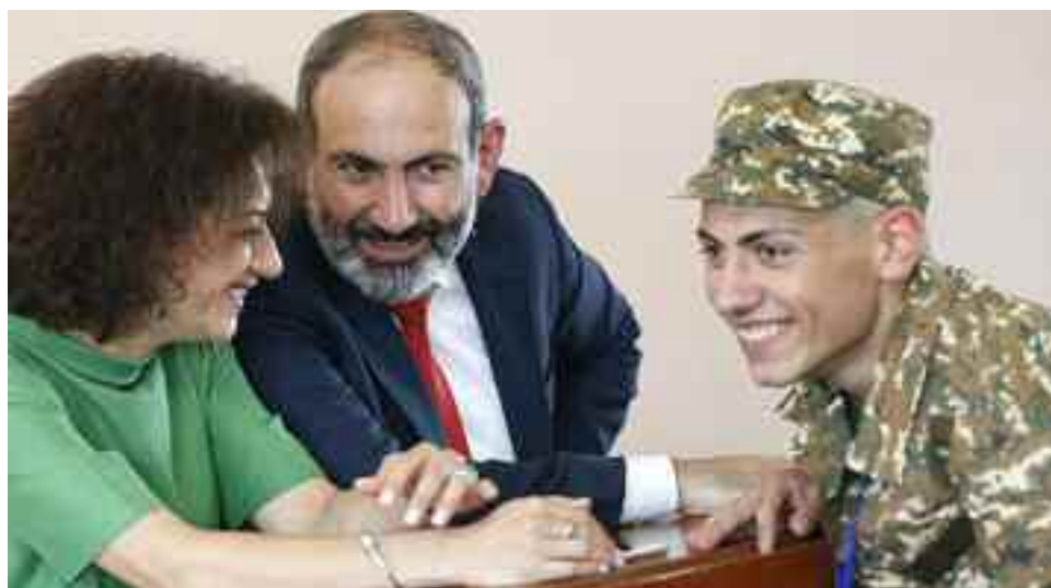
Nikol Pashinian y su esposa, Anna Hagopian enviando a su hijo Ashot al servicio militar en Artsaj.

Estas amenazas no son nuevas. Antes de abril de 2016, para disuadir la agresión de Azerbaiyán, la parte armenia también advirtió que daría una respuesta contundente. Y durante los combates de abril, después de que Azerbaiyán amenazara con ataques de misiles contra centros de población como Stepanakert, la parte armenia dijo que tomaría represalias contra la infraestructura energética de Azerbaiyán, incluso en Mingechaur y la terminal petrolera