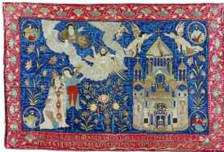
Altar frontal. Oro, plata y seda, de Nueva Yulfa. (1741)

camente iluminados, raras piezas textiles, cruces de piedra, preciosos ornamentos litúrgicos, maquetas de iglesias y libros im-