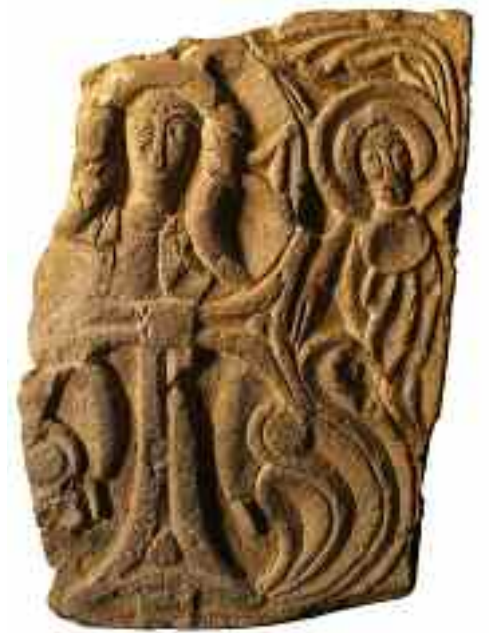
Fragmento de una columna de la ciudad de Tvin (siglos V-VII)