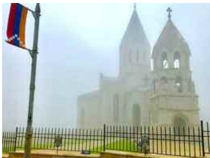
Artsaj. Entre 1918 y 1920 fueron masacrados en Shushi miles de armenios. Su catedral emblemática aún subsiste. El campanario original es de 1858. El resto fue reconstruido tras los bombardeos azeríes.

pogromos, persecuciones y operaciones de limpieza étnica contra los 500.000 armenios residentes, incluida la población de Nagorno-Karabagh. Las catedrales, iglesias y monasterios armenios fueron profanados y los que aún están en pie presentan un estado lamentable. Otra mentira vergonzosa