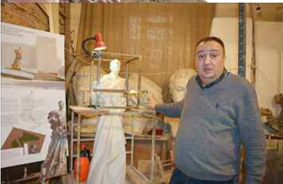
El escultor muestra la maqueta en el proceso de creación.

la creación del Estado armenio, énfasis: “¿Quién es Aram Manukián? Creo que no me equivoco al decir que nos estamos refiriendo a quien fue el mayor apóstol de la