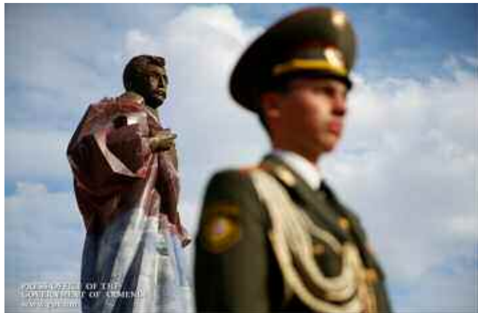
Cien años después. Un soldado posa ante el monumento al héroe de la primera República.