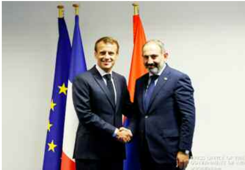
El primer ministro Nikol Pashinian se reunió con el presidente de Francia, Emmanuel Macron.

Pashinian destacó una vez más que Armenia está dispuesta al proceso de paz y