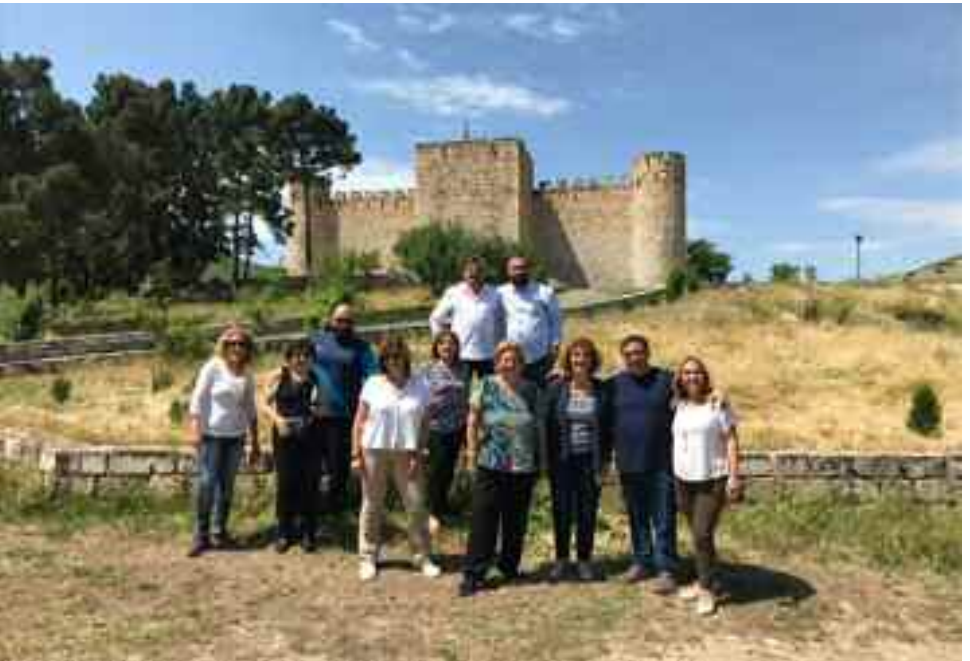
Մարտարապատի խումբը՝ Արցախի Տիգրանակերտի բերդին առջեւ Մայիս 2018

Instagram-ի վրայ բացուած է artsakh.travel-ի էջ, որ արդէն ունի 863 հետեւորդ: Աւելցած է նաեւ karabakh.travel-ի դիմատետրի էջի հետեւորդներուն թիւը՝ հասնելով 10661-ի: