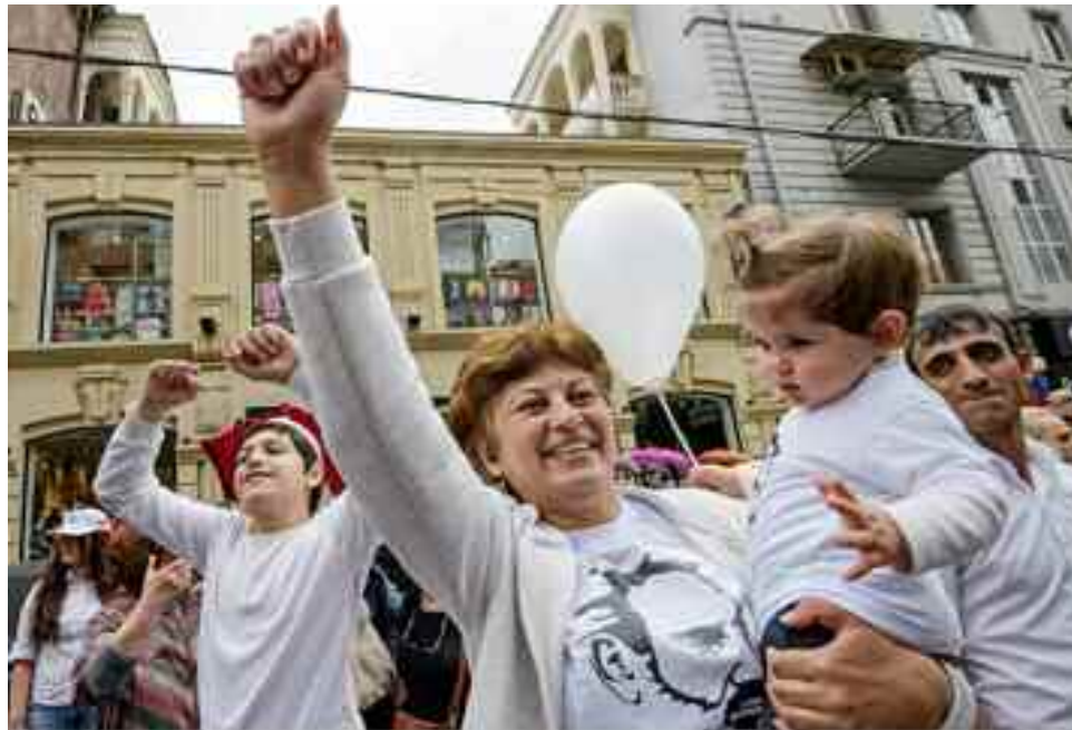
Manifestantes a favor de Pashinian en las calles de Ereván. 8 de mayo de 2018.