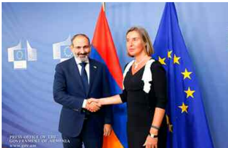
Nikol Pashinian saluda a Federica Mogherini.

Pashinian explicó que para Armenia la democracia no es una postura de política exterior sino un principio guiador, por el que su gobierno está dispuesto a avanzar.