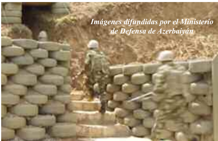
Imágenes difundidas por el Ministerio de Defensa de Azerbaiyán

“La incoherencia del lenguaje para consumo interno, no funciona en las negociaciones. Azerbaiyán necesita una forma más responsable y sensata para sentarse en la mesa de las negociaciones.