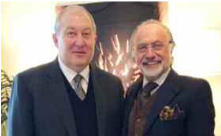
Durante la reunión con empresarios franceses.

Al término de su visita a Londres, Armén Sarkisian ofreció una recepción de despedida, que contó con la presencia de numerosos diplomáticos extranjeros acreditados en el Reino Unido.