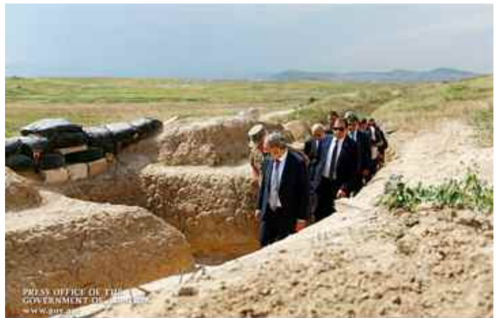
El primer ministro y sus colaboradores recorren la línea de contacto entre fuerzas armenias de Artsaj y Azerbaiyán.

Con estas palabras, el primer ministro Nikol Pashinian respondió por Facebook Live (en vivo) a una pregunta formulada por un ciudadano armenio, en una práctica que ya se ha vuelto habitual en la gestión del nuevo gobierno: la utilización de las redes de comunicación para acercarse a la gente, escuchar sus preguntas, reclamos, propuestas y sugerencias de manera directa.