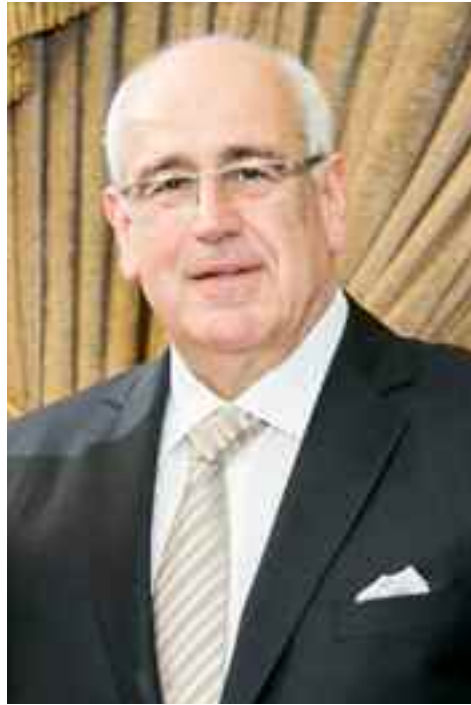
República soberana con una Nación global fuerte.”

Por otra parte, remarcó que “estas reuniones refuerzan las relaciones de Armenia con la Diáspora, lo que le da a Armenia la oportunidad única de ser una