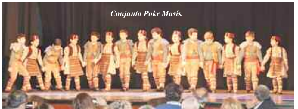
Conjunto Pokr Masís.