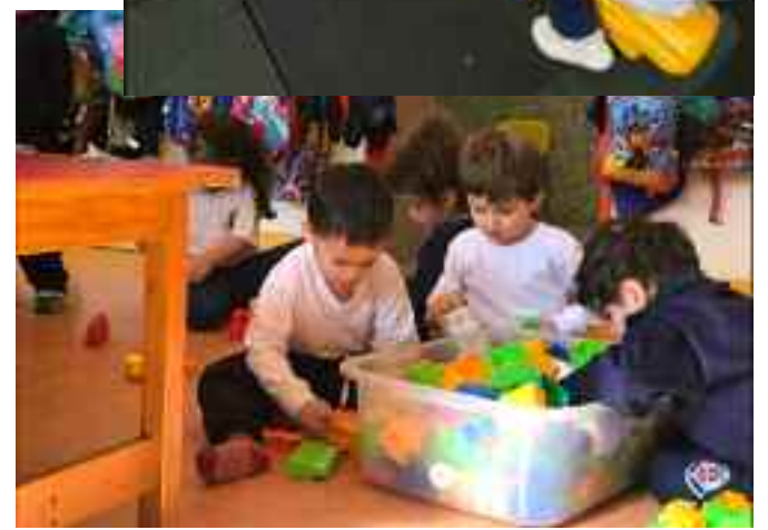
Una vez más, los alumnos del Instituto Marie Manoogian de la Unión General Armenia de Beneficencia

han recibido con el entusiasmo y la gratitud de los más pequeños, infinidad de juegos didácticos y para el patio exterior de los cuales disfrutaron todos los días.