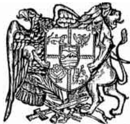
Escudo de la República de Armenia (1920)