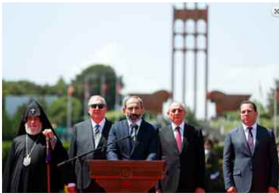
De izquierda a derecha, S.S. Karekín II, el presidente de Armenia, Armén Sarkisian, el primer ministro Nikol Pashinian, el presidente de Artsaj (Karabaj) Bako Sahakian y el ministro de Defensa de Armenia David Donoian.

Un pueblo esperanzado y feliz, que no puede dejar de relacionar la historia con los acontecimientos políticos del último mes, siguió con fervor patriótico el acto en el que hubo una notoria demostración de fuerza, determinación, empuje, voluntad y nacionalismo, tanto por la presencia militar