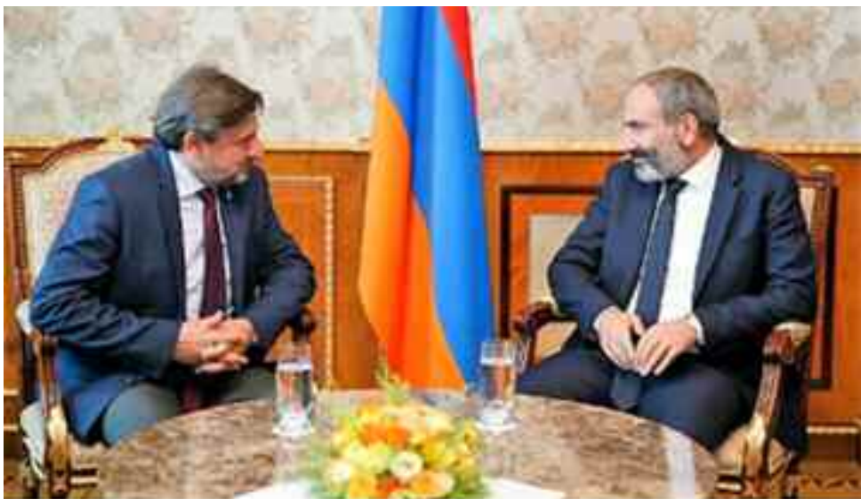
Tras el acto y desfile militar en Sardarabad, el primer ministro de Armenia, Nikol Pashinian, recibió al Consejo Central de la Organización Demócrata Liberal Armenia, presidido por el Sr. Sergio Nahabetian. (Información en páginas 3 y 9)