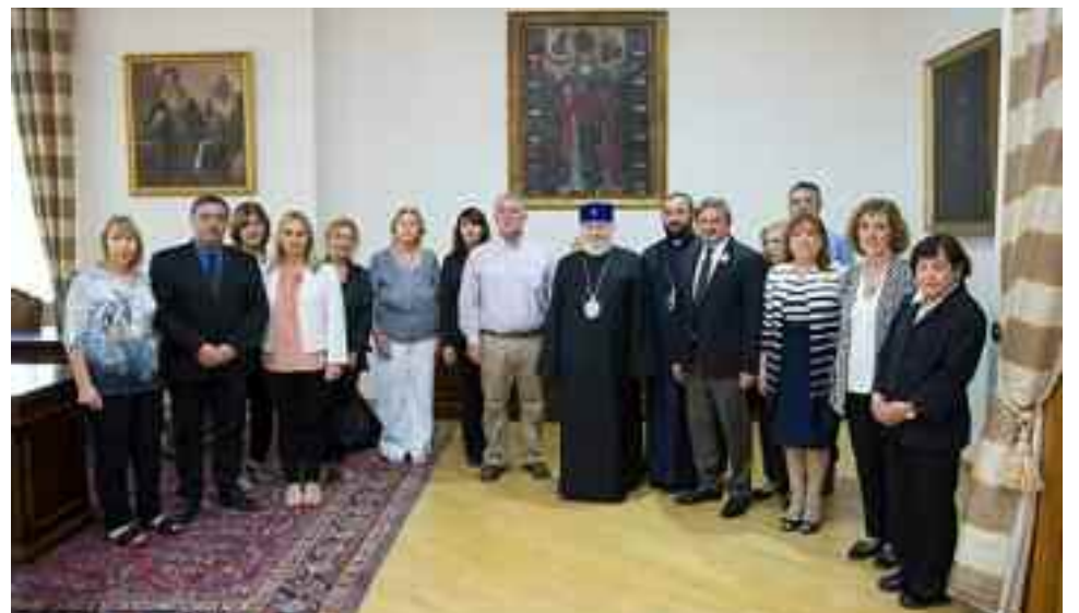
El domingo 27 del corriente, previo a la Santa Misa, el katolikós de todos los armenios y patriarca supremo, S.S. Karekín I recibió al grupo de Sardarabad, que viajó para el centenario de la 1° independencia de Armenia. (Ver pág. 3)