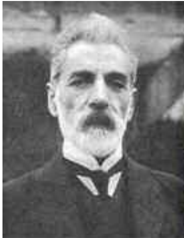
El ministro Hovannés Kachaznuni

Ya en 1990 el gobierno adoptó la Tricolor como Bandera de Estado por medio de una ley el 24 de agosto de 1990, como