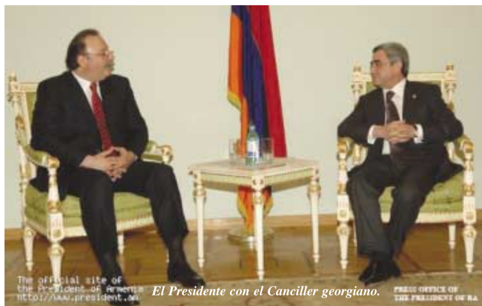
The official site of the President of Armenia: http://www.president.am El Presidente con el Canciller georgiano. PRESS SERVICE OF THE PRESIDENT OF RA

Otros de los temas tratados fueron la estabilidad y la seguridad en la región.