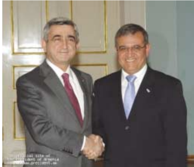
El Presidente Serge Sarkisian recibe al Embajador de Israel, Shemi Tzur.

En cuanto a la resolución de conflictos por la fuerza, las partes destacaron que los conflictos existentes no tienen