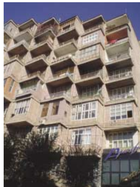
El edificio de Gomidás 38

Para contactarse con él, se puede hacer a través de correo electrónico a: