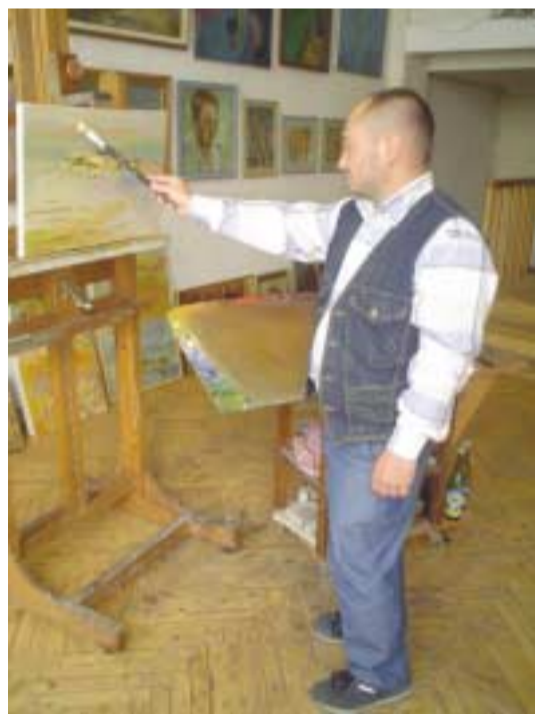
Trabajando en su última obra.