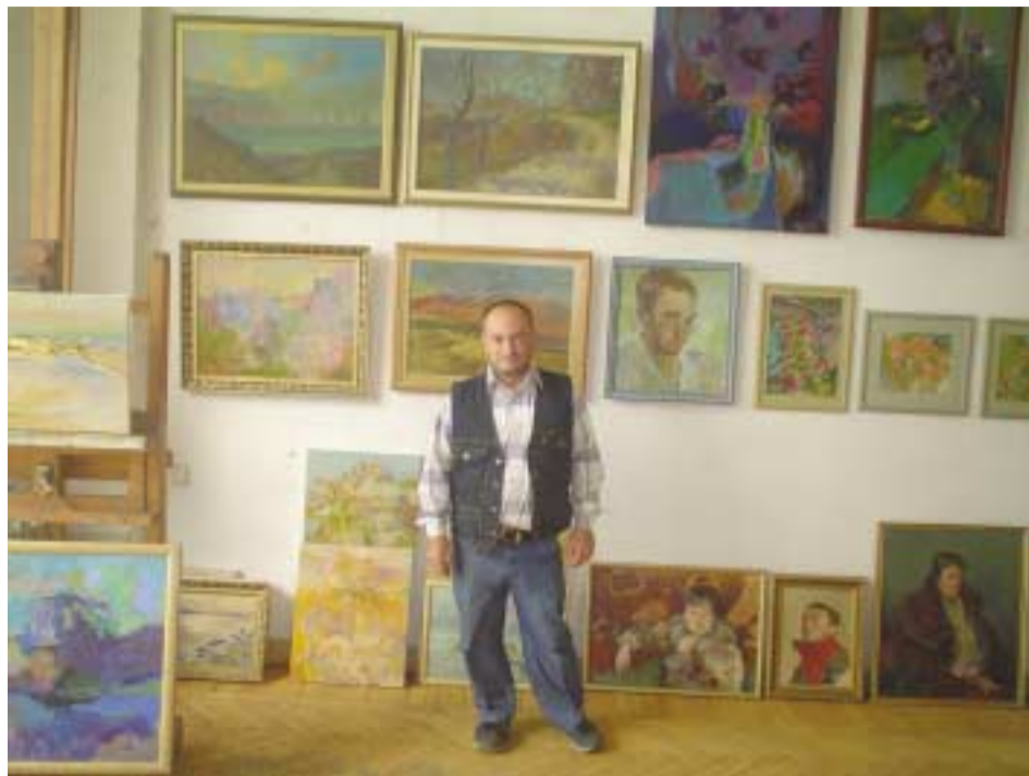
El artista en su atelier.

Sus obras figuran en catálogos internacionales y en colecciones particulares de distintas partes del mundo.