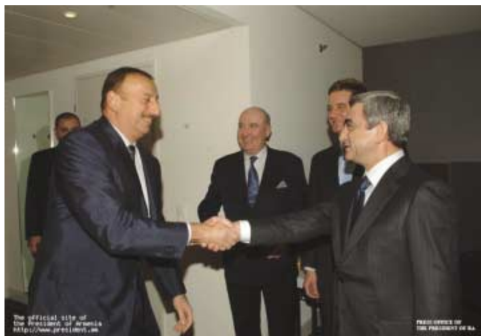
Se saludan los Presidentes de Azerbaijón y de Armenia, en presencia de los copresidentes del Grupo de Minsk de la O.S.C.E.

El Ministro de Relaciones Exteriores de Armenia, Edward Nalbandian, aunque también se mostró optimista, sostuvo que «si hubiera resultados concretos, los anunciaríamos». Entre tanto, su par turco expresó que «el proceso continúa. Nuestros contactos siguen