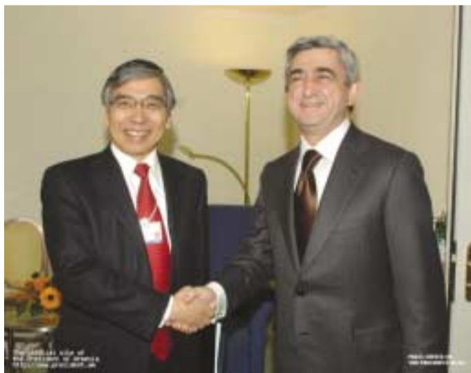
El Presidente, con Haruhko Kuroda

Tanto el Presidente armenio como el azerí expresaron su satisfacción por el hecho de que los copresidentes estén trabajando para sincronizar las posiciones de las partes. Durante la reunión, también se definió la próxima visita de los copresidentes a la región.