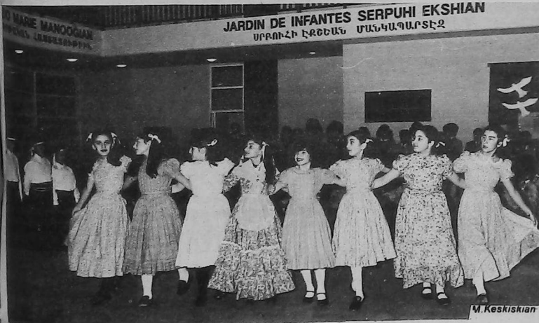
Danza Folclórica Argentina, por los alumnos de la seccion primaria.

California 24 DE ABRIL: DIA OFICIAL DE RECORDACION"