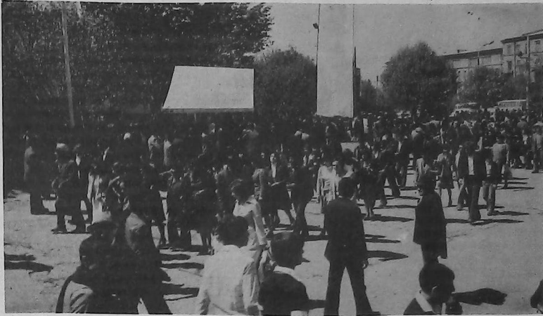
Vista parcial del público presente en la inauguración.