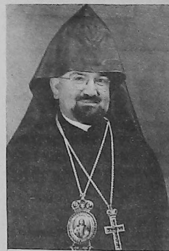
Mons. Bessak Toumaïan

Cambiarán los hombres y las generaciones pero los ideales y el objetivo serán siempre los mismos: la manutención de la armenidad en la diáspora.