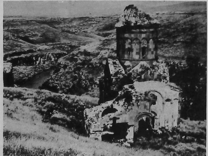
Ruinas de la Iglesia San Gregorio el Iluminador en Anı.

justicia del problema armenio. Solicitamos al jefe máximo de la Iglesia Apostólica Armenia S.S. Vazken I, que tenga a bien dirigirse al Consejo Mundial de Iglesias y pida la colaboración de sus máximos organismos; pedimos a Erevan que haga valer su influencia gubernamental para neutralizar este acto de genocidio cultural cometido por el gobierno de Turquía. Es hora de que Erevan hable claramente de éste y otros temas referentes a la cuestión armenia y asuma la defensa de nuestros derechos. Hacemos por fin un llamado al gobierno de Ankara para que cumpla con su deber de reabrir al culto la capilla de Kirikjan porque así lo exige el Derecho de Gentes.