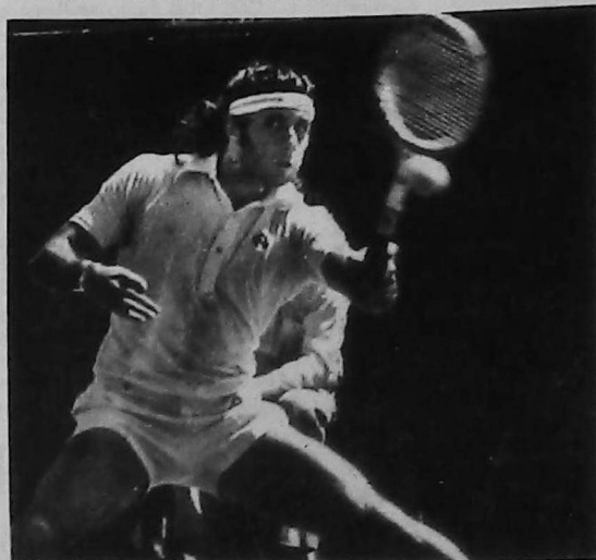
Guillermo Vilas antes de consagrarse primer tenista del mundo.

escasos 25 años. Que la dadero maestro del trabajo juventud armenia también sin desmayos y de la encuentre en él a un ver-modestia.