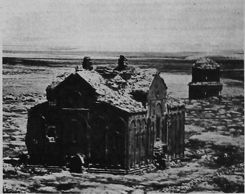
Aspecto actual de la Catedral de Anı

Kirikjan es un lugar muy poco conocido de la provincia de Hatay. A simple vista, el hecho de desposeer injustamente a la población armenia del último lugar que le quedaba para practicar su culto, pareciera un acto sin mucha importancia; pero es la repetición de la barbarie frente a la cual es ya indispensable adoptar medidas decisivas, difundir este acto y luchar con voluntad férrea por su reparación. Informaremos a los armenios del mundo por medio de la prensa internacional; aunaremos criterios y fuerzas y exigiremos a las potencias el cumplimiento de los Tratados internacionales.