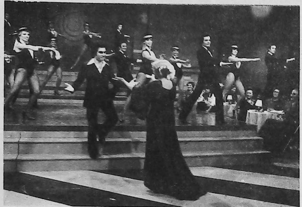
El renombrado astro y cantante Manuel actuó el lunes 5 de setiembre pasado en el programa "Tropicana Club" que emite semanalmente Canal 9 de Buenos Aires. Dentro de algunas semanas las colonias armenias de Sud América tendrán la oportunidad de ver por primera vez la película que lo llevó al estrellato: "Lágrimas de felicidad".