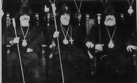
Su Santidad Vazkén I, rodeado por los patriarcas Derderian y Kalusdian.

Հոյեկան մեծ դիտունակութեամբ կարողացին տեղակայ մամուլի մէջ, թէ ուսմանի առիթով ուսանողական բախումները, փողոցային կոխները եւ արհմիութիւնի ղեկավարները զարգեցան: Մինչեւ իսկ Արշակունիական Տնօրէնութեան իրաւասու ղեմերը հարցաւորուեցին: «Հակամարտ ուսանողական խումբեր կարծես զինուորացի կերպով են իրարու նկատմամբ վերջին օրերս»: