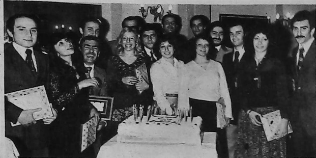
EGRESADOS UNIVERSITARIOS HADJENTZI