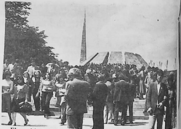
El pueblo de Armenia una vez rendido su homenaje se retira del monumento que recuerda el holocausto.