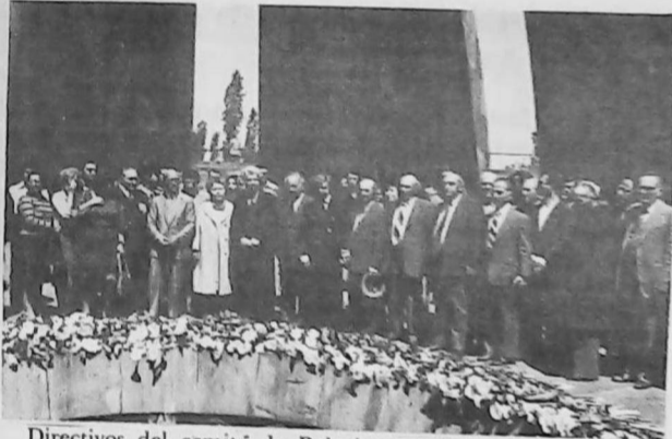
Directivos del comité de Relaciones Culturales de Armenia con la Diáspora, y un grupo de turistas de todo el mundo rinden su homenaje.