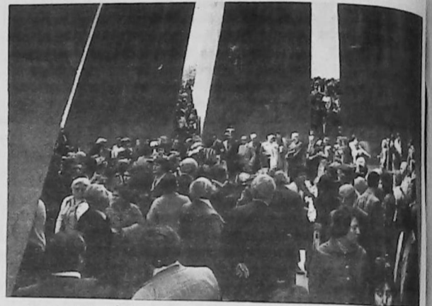
Parte del público asistente al homenaje a los mártires del 1º Genocidio del Siglo.