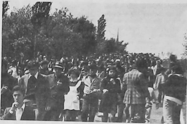
Caravana interminable formada por el pueblo de Armenia, que dice presente a sus mártires.

Commemoración del 24 de Abril de 1979 en Ereván