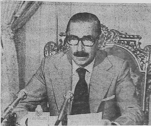
El Presidente de la Nación pronuncia desde su despacho de la Casa de Gobierno el mensaje que dirigió el país el día 31 de marzo.

"El quehacer primordial del gobierno, que ahora coloca su centro de gravedad en el diálogo y la participación, supone, además, su acción en diversas áreas igualmente decisivas..."