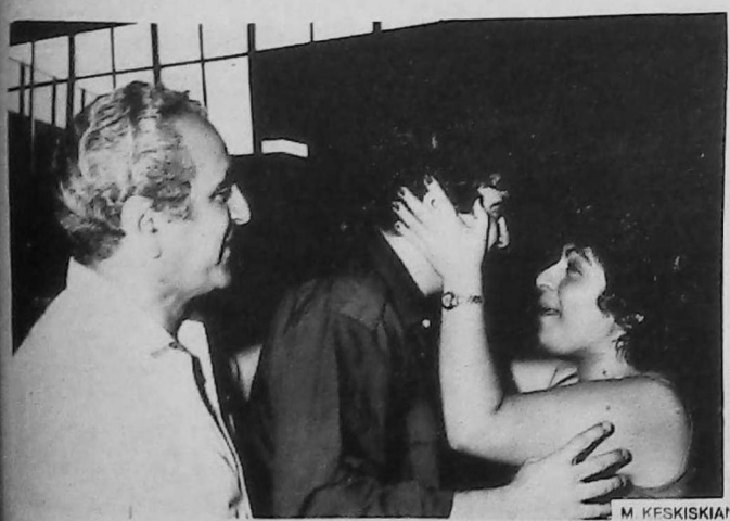
En un momento del reencuentro