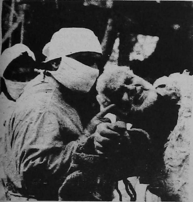
Imagen de la película, "Crónica de los días en Ereván".