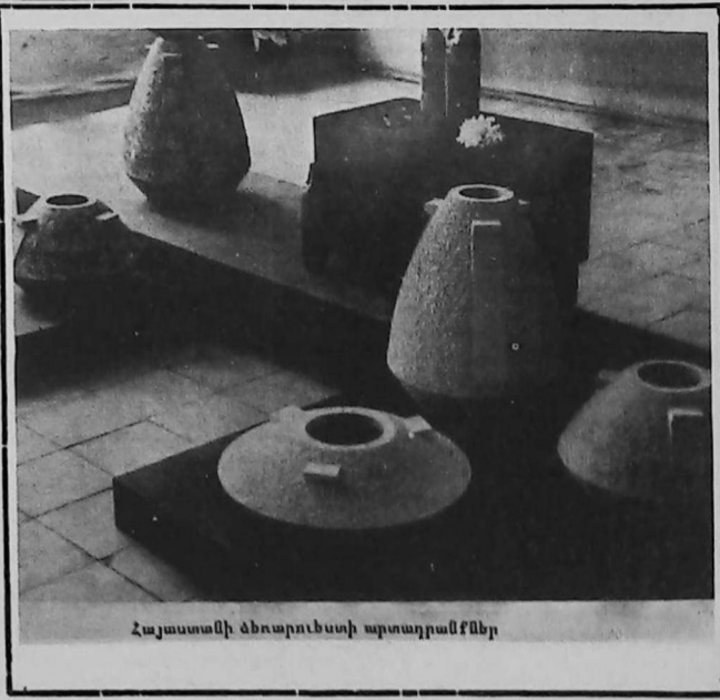
Հայաստանի ձեռնարկուած արտադրանքներ

հոն հասնելու համար: Գուցէ իրեն պակսեցաւ զորաւոր կամքն ու անհատականութիւնը իր այդ բարի փափաքը ի կատար հանելու: Իր թափուր թողած պաշտօնին անշուշտ թէ ուրիշ յաջորդ մը պիտի գայ: Բովանդակ գաղութիս, բայց մանաւանդ եկեղեցւոյ վարչութեան կը մնայ իմաստութեամբ գործել, չունենալ պողոկոմներ եւ անհարկի ընդվզումներ, որոնք միակողմանի ըլլալու հանգամանքով, վիճելի կը դարձնեն իր անկեղծ վերաբերումը ազգային հոգեւոր կեանքի նըկատմամբ: