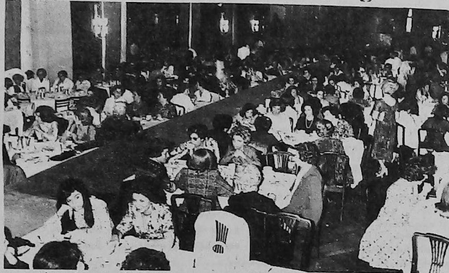
Aspecto general del Té-Desfile en el Plaza Hotel.