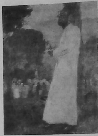
Padre "Gomidás" por Eghishé Tatevosian

A la edad de 11 años quedó completamente huérfano. Un año después le trasladaron a Etchmiadzin e ingresó al Liceo Religioso Kevorkian. Pronto el adolescente reveló una extraordinaria aptitud literaria y musical. Los tres años de altos estudios cursados en Berlín lo convirtieron en un erudito.