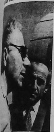
Profesor Victor Hampartsumyan en el observatorio de Ereván.

de un moderno industrial los astrofi- penetraron en Universo y vapor de agua en "Hervidero". hallazgo los cientí- suponían que vapor de agua en frías.