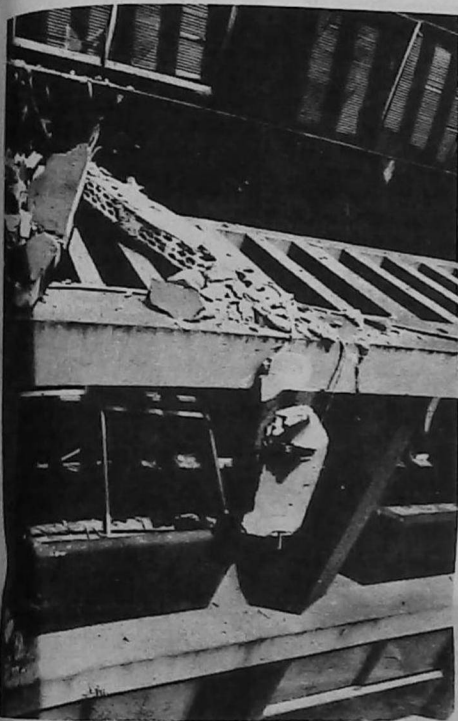
Frente del edificio del Centro Tekeyan

El siguiente reporte está revestido de una importancia fundamental. La situación en el Líbano, aunque urgente, permanece desde hace demasiado tiempo sin modificación ni cambios. Nos hemos dado cuenta de la inutilidad de hacer hincapié en esto, pero la deplorable realidad es que los armenios de la diáspora están desamparados en la cuestión de encontrar una solución.