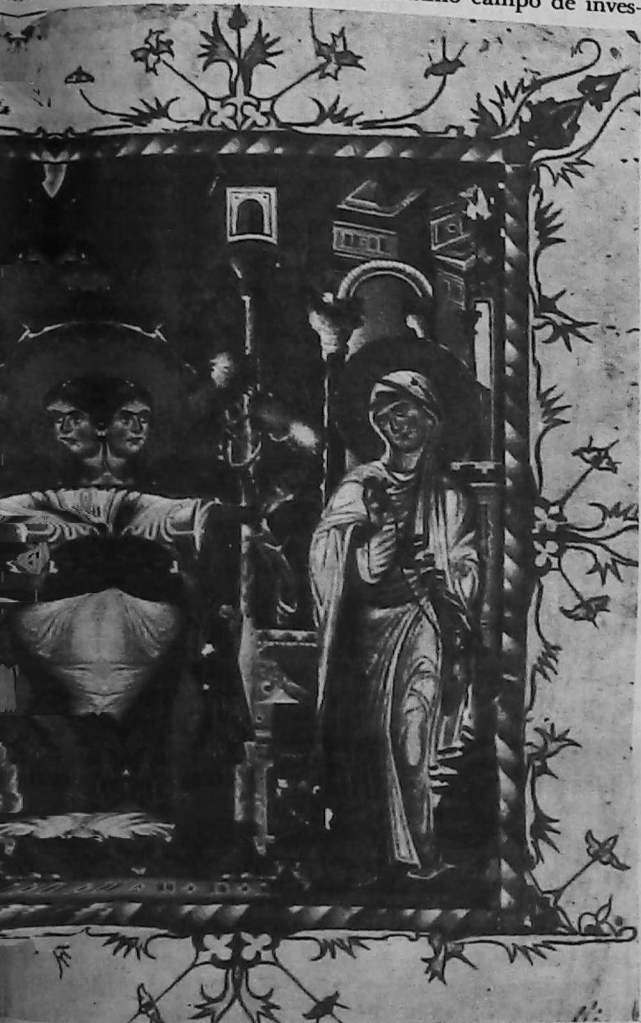
Anunciación, miniatura de un evangelio del siglo XIII, obra del pintor Toros Roslin. Hay siete manuscritos que llevan la firma de este notable autor de los cuales cinco están conservados en la biblioteca del convento armenio de San Jacob en Jerusalén, uno en la biblioteca nacional de Baltimore EE.UU. y otro en el Madenatarán de Ereván.