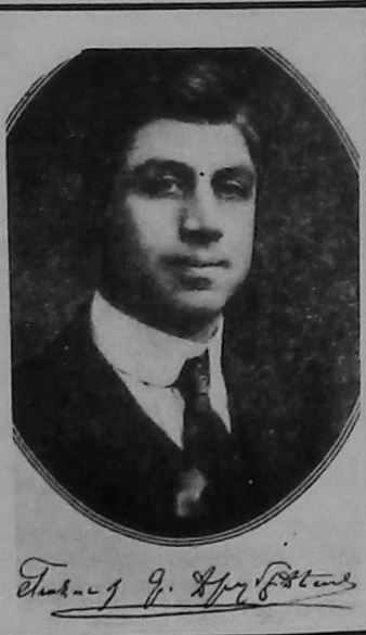
Կեանքի Գ. Արշալույս