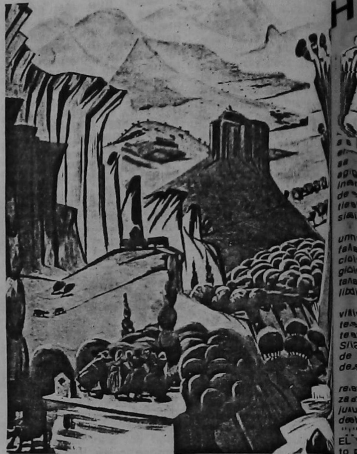
•Armenia (Mardiros Sarian)

Inesperadamente, el Imperio Otomano se vio conmovido y se levantó contra Rusia. El sultán, por incitación de las potencias cristianas de Europa, amenazó con luchar contra Moscú. El zar, quien no se hallaba en condicio-