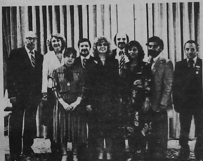
Miembros de la Comisión organizadora.