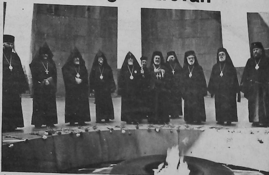
S.S. Vazken I, y el Patriarca ortodoxo griego, con sus comitivas, oran en Zizernagapert

Durante los días 25 al 28 de octubre p.p.d. visitó Armenia al Patriarca Iknatios de la Iglesia Ortodoxa Griega y de Antioquía, acompañado de una comitiva oficial.