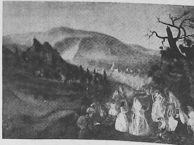
Picnic en Kour

Una de sus composiciones más famosas, demostrativa de su talento innato es "Picnic en Kour".