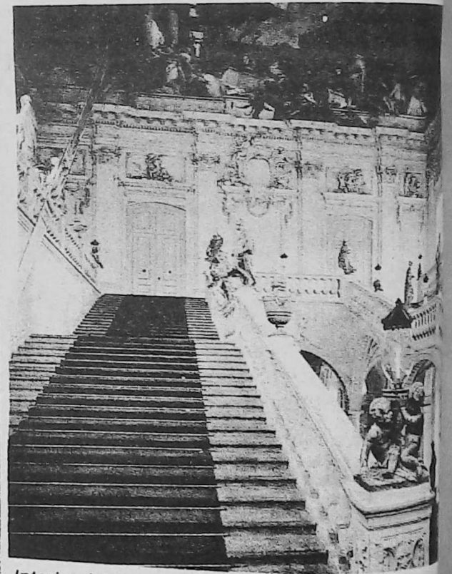
Interior del palacio

La pintura fue ejecutada entre 1730 y 1740. Probable que el pintor hubiera puesto en contacto con la tradición cultural armenia, en Venecia, puesto que el ábate Mekhitar se encontraba en aquella ciudad italiana, ya en 1717.