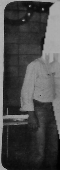
Representantes de la delegación Youssefian.

De acuerdo con estos resultados, la delegación de Buenos Aires se adjudicó la copa "Ar-