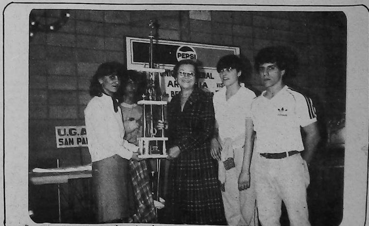
Representantes de la Delegación de Bs. As. reciben la copa por el primer puesto.

Los jóvenes vivieron una verdadera fiesta deportiva en un clima de camaradería y sano compañerismo, que sumados a una excelente organización hicieron que las X Olimpiadas, dedicadas a las Bodas de Diamante de UGAB, fueran realmente inolvidables.