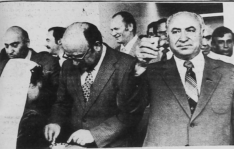
Հայրենի Պետական մերկայացուցիչ՝ Եուրի Խոնամիրեան կ'ընդունի աղ ու հացի աւանդական դիմաւորումը, մինչ վարչապետ Սարգսեան բաժակը կը բարձրացնէ Հայ ժողովուրդի կեանքը:

Հայր ենք արդէն: Երէկի արձամարտում եւ լքուած երկիրը, վաթսուս տարուան ընթացքի դարձած է խոյանքներու ընդունակ երկիր: Այսօր ան կը մասնակցի Միջազգային ցուցահանդեսներու, ընդլայնելով իր յարաբերութիւնները բազմաթիւ երկրներու հետ, ներկայացնելով նոյնատես հնարաններ ժողովուրդի մը մտքի եւ ձեռքի նորագոյն ստեղծագործութիւնները: Եւ աննշան երեւոյթ է այս մասնակցութիւնը: