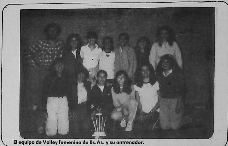
El equipo de Volley femenino de Bs.As. y su entrenador.

Como anunciáramos en nuestros números anteriores, del 23 al 27 del corriente, se realizaron las 10 as Olimpiadas de la Liga de Jóvenes de la Unión General Armenia de Beneficencia, en Montevideo, República Oriental del Uruguay.