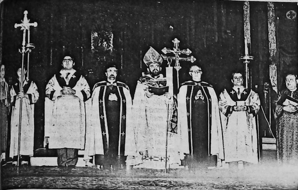
Misa de Requiem en la Catedral Metropolitana. Oficiada por el Exarca de los armenios católicos, Vartan Waldir Boghossian.