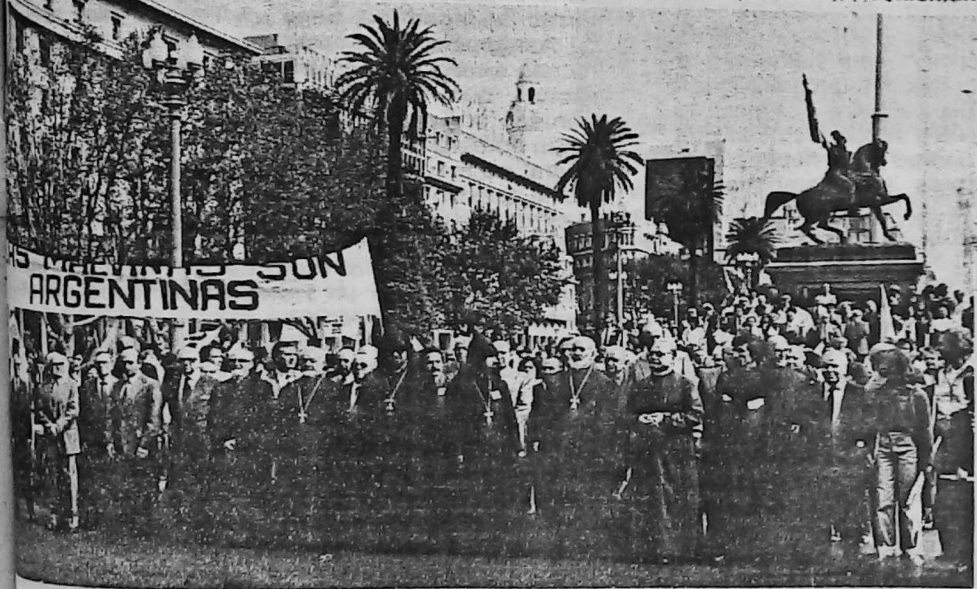
El clero encabeza la manifestación de la colectividad armenia en Plaza de Mayo.