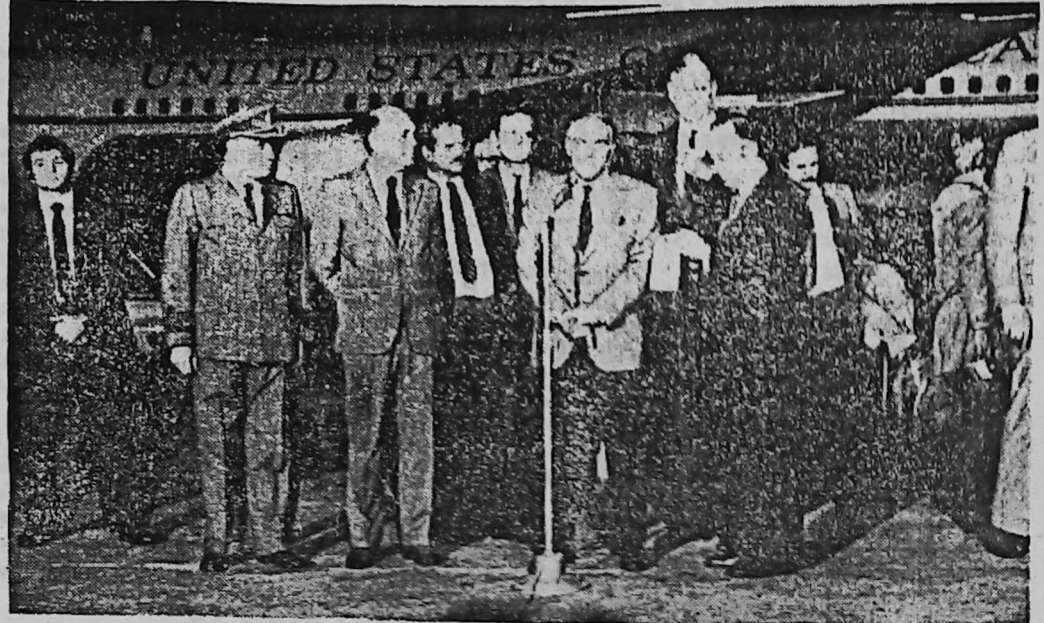
Մ. Նահանգներու Պետական Քարտուղար Զօր. Հէյկ Էսէյասյի օգակայանին մէջ

Մ. ՆԱՀԱՆԳՆԵՐՈՒ ՊԵՏԱԿԱՆ ՔԱՐՏՈՒՂԱՐ ԶՕՐ. ԱԼԵՔՍԱՆՏՐ ՀԷՅԿ ՊՈՒԷՆՈՍ ԱՅՐԷՍ ԺԱՄԱՆԵՑ ԲԼԱՍԱ ՄԱԺՈՆ ԴԱՐՁԱԻ ԱՐԽԵՆԹԻՆԱՑԻՆԵՐՈՒ ԿԱՄԻՆ ԵՒ ԱՆՍԱՍԱՆՈՒԹԵԱՆ ԱՌԱՆՑԻ