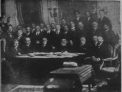
ՊԱՐԻՍԻ ԱՆՎՈՐՈՒՄԻ ՀԱՄԱՐՈՒՄԸ Մտնելի շարքի մը վրայ կ'ընդունին Վաչարութեան Կ. Քիլոմետրի ուղղութիւնը։

«Հայաստան կ'ընդունի գործադրելի գլխաւոր դաշնակից պետութիւններուն հետ այն պայմանները, որոնք անիրաւի ժողովուրդներու կ'ընդունին այս պետութեանց կողմէ պաշտպանելու համար շահերը փոխանցուող նկատուող ժողովուրդներուն, որոնք պետական ժողովուրդի մեծամասնութեան կը տարբերին ճշգրտելի, լիզուական եւ կրօնական գետնի վրայ։ «Հայաստան միաժամանակ կը հաւանի ընդունելի գլխաւոր դաշնակից պետութիւններուն հետ այն պայմանները, որոնք անիրաւի կրնան համարուի այս պետութեանց կողմէ տարբերակաբար պատուութիւնը պաշտպանելու եւ արդար վերաբերում ցոյց տալու ուրիշ ազգերու առեւտրական գործունեութեանց նկատմամբ։