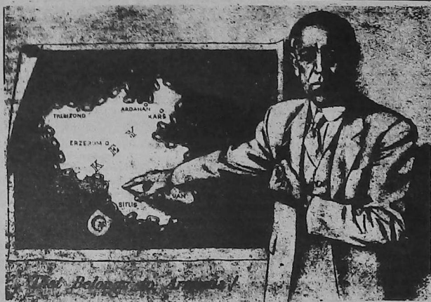
Los límites de una Armenia libre e independiente fueron establecidos por el presidente de los Estados Unidos Woodrow Wilson, según los términos establecidos por el Tratado de Sevres, firmado el 10 de agosto de 1920 por las victoriosas Fuerzas Aliadas de la Primera Guerra Mundial.