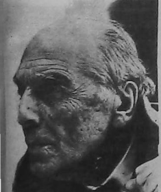
Parsegh Ganatchian nació en 1855, en Rodosto, Tracia Oriental.

Con motivo del 95 aniversario de su nacimiento