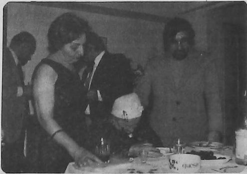
Մայրամուտի փոստը կույզի շրջանի աշակերտները:

Հարիւրամեայ արկածային կեանքի մը գեղեցիկ մայրամուտը յաճախ վիճաշուժ հանդարտութիւն մը կ'ունենայ: Յոյեմբ' որոնք անուշադիր դիտողի մը առկայք նրազներ պիտի բուռնին, խորաբախանց աչիկն առջեւ, անոնք կը վերածուին լոյսի բոսոր հեղեղներու, եւ փայլ կուտան մարմնոյ հորիզոնին: