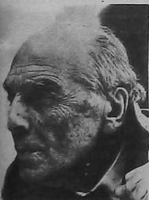
Parsegh Ganatchian nació en 1885, en Rodosto, Tracia Oriental.

Con motivo del 95 aniversario de su nacimiento