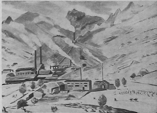
Las minas de Alaverdi, en Armenia.

En 1920, luego de rechazar una cátedra de profesor en la Academia de Bellas Artes de Moscú, Sarian, a invitación del gobierno, se instala definitivamente en Ereván y posteriormente es enviado como representan-