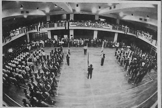
Ceremonia inaugural de las XI Olimpiadas.