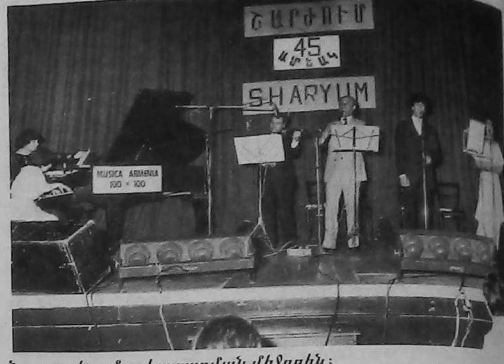
Նուագախումբը կատարման միջոցին:

Ատենէ մը ի վեր իր եղբայրներով մեզի ծանօթ խումբը, ամբողջապէս հայկական երաժշտութեան