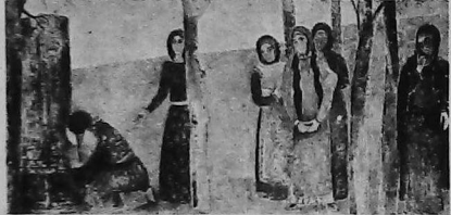
Niñas ante los Jach-Kar. 1972. Mural 300 x 500 cm. Ereván.

En las obras de Minas vemos frecuentemente el sol. El sol todo lo transforma y perturba las medidas naturales. Dar color a esto es difícil. Pero Minas no le temo a la iluminación y al sol: él se encamina hacia ese mundo. Los colores jugaron un papel importante en sus obras. Los mismos no guardan equilibrio y son ajenos a la pintura armenia actual. Minas ha elegido colores relacionados entre sí, y en las manos sensibles de éste fino artista, la unión de colores sirve a la realización de la obra. El sentido de un color, depende de los colores que lo rodean.