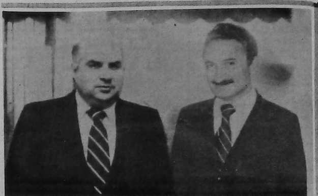
«The Armenian Reporter»ի խմբագիրը՝ Էտուրոս Պողոսեան, Յունիս 17-ին, Անգարայի մէջ հարցազրոյց մը ունեցաւ Թուրքիոյ վարչապետ Պիլենթ Էճեփի հետ ու այսպէ՛ս արտաքին գործոց նախարար Կիւնալիզ Օքճիւնի հետ:

Տղմտ շուրբու մոյնքան պղտոր նկարագրով ձկնորսներուն միայն յատուկ է արուեստական յարուածութիւն ստեղծել, ու տիրող խտնաշխութութեանն օգտուելով՝ աջ ու ձախ անձեր ու կազմակերպութիւններ հարուածել: