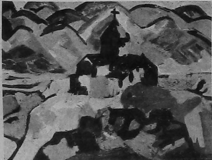
— Monasterio de Sevan 1962. Oleo, 50 x 70 cm. Colección Privada, Ereván.

Uno de los principales pintores armenios contemporáneos fue Minas