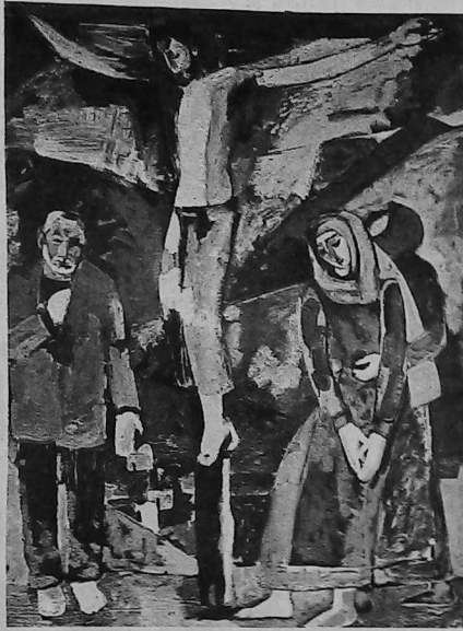
— En memoria de mi madre 1969. Oleo, 150 x 130 cm. Destruído en el incendio.

Avedisian emerge como artista en 1962, en la denominada "Exhibición de los cinco", (Ereván), donde revela una madurez pictórica, con una fuerte personalidad. Muchos críticos y visitantes ponderaron la obra exhibida. Un artista francés, Jean Lurcat