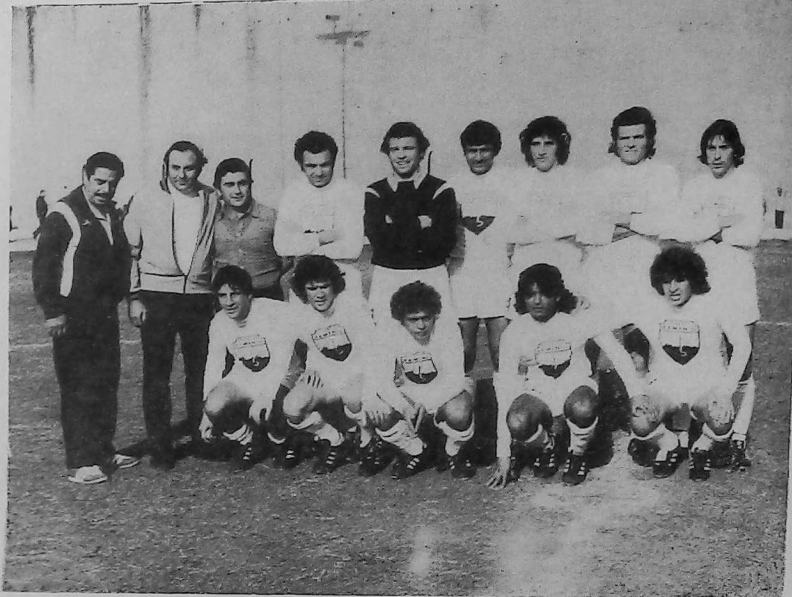
INTEGRANTES DE DEPORTIVO ARMENIO

Estos deportistas y atletas, vencedores cada uno en su especialidad, llevan a través del mundo su capacidad y talento en representación de su país de origen.