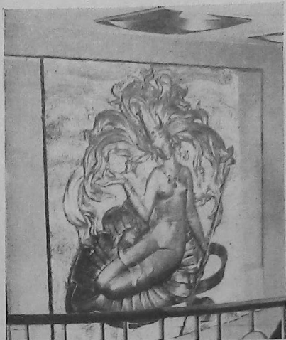
El Ojo de Nepluno: Hermosa obra artesanal artística que figura entre otras en el Barco Armenia