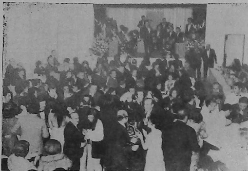
La colectividad armenia de Rosario, organiza Cenas-Danzantes para beneficio de la Escuela

Esta colectividad pequeña pero pujante, se organizó como Institución en 1951 adquiriendo un predio en el Boulevard Oroño, donde funciona también la escuela idiomática que sostiene.