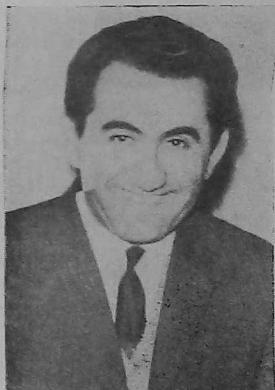
Nuestro compatriota nuevamente entre los primeros