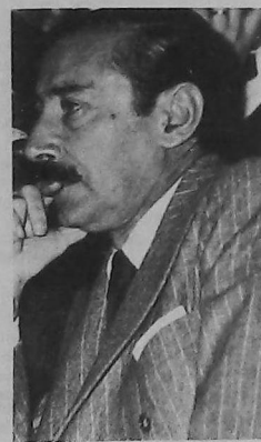
Presidente J.R. Videla

En torno al presupuesto, dijo que "es una herramienta de trabajo que permite manejar las disponibilidades para aplicarlas donde mejor convengan, de acuerdo con las prioridades".