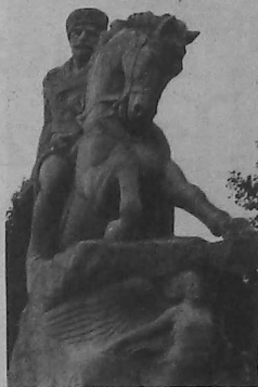
Tumba y estatua del General Antranig

Y, mañana, el pueblo de la Patria no se conformará con la estatua que honra al Gran Antranig en el pueblo de Uchan, Armenia actual, sino que, con orgullo, hará trasladar los restos de nuestro General desde Per-Lachez, en París, al Panteón de los Héroes en Erevan, capital de Armenia, en uno de cuyos parques principales levantará su estatua como un Sasuntzi David de nuestros tiempos, aparte de sus bustos en Zangezur y otros pueblos que él liberara. Es que Antranig se ha transformado en uno de los más importantes libertadores del mundo, además de un líder mitológico y patriota desinteresado, así como en héroe inigualable en el corazón de su pueblo.