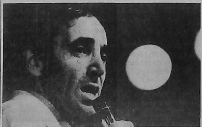
La actuación de Aznavour fue todo un éxito.

Ante una concurrencia -francés incluyó en su de más de mil personas, repertorio la canción "Mis Charles Aznavour ofreció sont tombé", dedicada a un recital que se extendió los mártires del 24 de abril por más de una hora: el 1915. famoso cantante armenio-