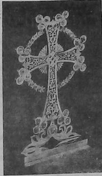
El jachkar de plata obsequiado a la Reina.

La colectividad armenia de Londres obsequió a la