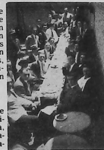
En lo de Kissek, en Canning y Cabrera, con la delegación de Montevideo (Año 1931).

madres, mientras los muchachos las atisbaban en compacta masa junto a la puerta y desde allí les hacían furtivas señas con las cejas para sacarlas a bailar.