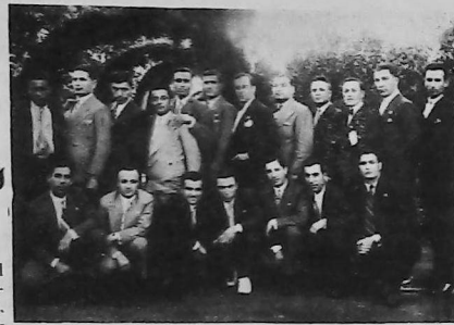
La Comisión Directiva de UGACF de Bs As. con la de Montevideo y amigos (Año 1931)

madres, mientras los muchachos las atisbaban en compacta masa junto a la puerta y desde allí les hacían furtivas señas con las cejas para sacarlas a bailar.