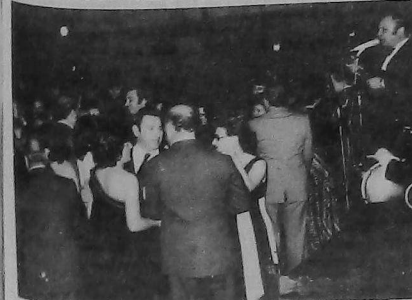
Un aspecto del baile

Córdoba celebró su 52° aniversario con una comida.