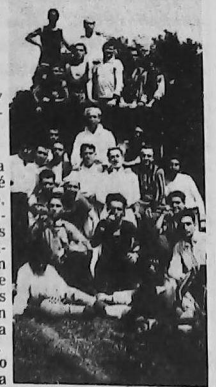
Pic-nic en Quilmes.

aplausos de toda la colectividad armenia de Bs. As. para rendir homenaje a los fundadores de la UGACF, a las sucesivas comisiones directivas y hoy en las Bodas de Oro, a quienes tienen la responsabilidad de su conducción, deseándoles que continúen por la brillante trayectoria que previeron sus creadores y la concreción de sus máximas aspiraciones para el bien común de los armenios.