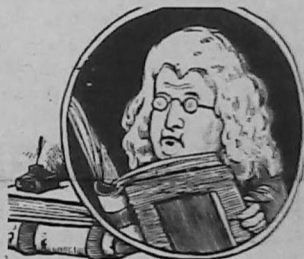
"Riz Taza" (Nueva Vida).

Desde hace cuarenta años, se edita en Ereván, el diario