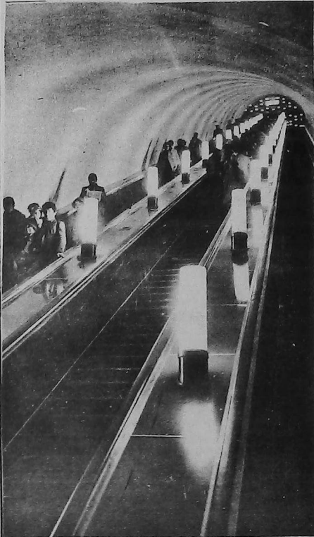
ՇԱՐԺԱՍԱՆԻՈՒՄԸ ԿԸ ՏԱՆԻ ԳԷՊԻ ԵՐԵՒԱՆԵԱՆ ՄԵԹՐՕ (SUBWAY)