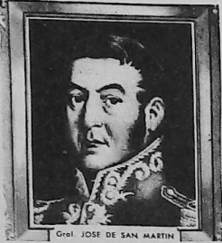
Genl. JOSE DE SAN MARTIN

El próximo 17 de agosto se cumplirá el 131° aniversario del fallecimiento del padre de la Patria, don José de San Martín. "SARDARABAD", en nombre de sus adherentes y de toda la comunidad armenia, se hace partícipe de esta nueva festividad patria, augurando paz y progreso a la gran ARGENTINA, que tan generosamente recogió en su seno a la colectividad armenia.