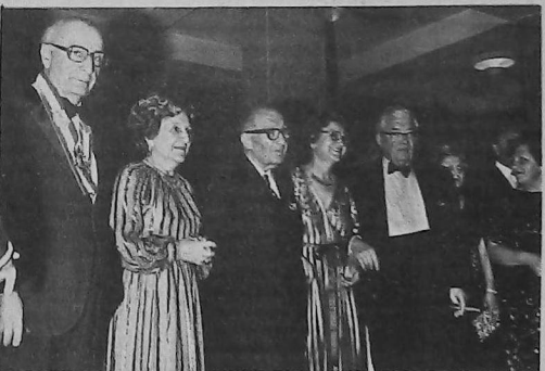
Պատմական հանդիպում 1978-ին Մոնթեվիտեայի մէջ

Կարեւոր հանգրտան մը կազմուեցաւ հանդիսական և տօնակատարութեան արտիով, Մարտաբապատ կուզայ հրապարակ շնորհատրը Հոգեհ. Յոնեմարտէս սպանելով որ ան արդարացեալ իր մեծ կոչումը, որպէս սպասարար թրիստոնական վարդապետութեան տրամադրութիւնները, որոնք խաչի ճամբան կը խորհրդանշեն, որոնք ենթական կըս: