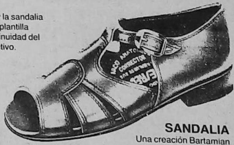
SANDALIA Una creación Bartamian para disfrutar del tiempo libre, la primavera y el verano con un calzado cómodo y elegante.