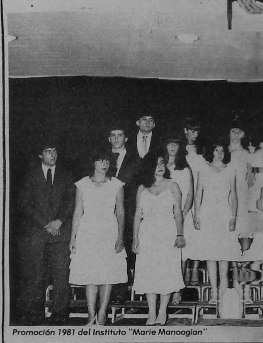
Promoción 1981 del Instituto "Marie Manoogian"

Gracias a la Liga de Jóvenes por reunirnos en el cálido ambiente de la armenidad.