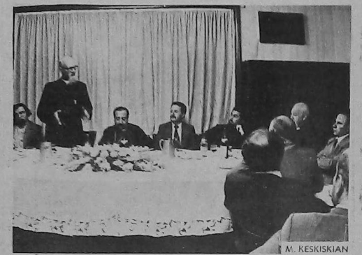
Հոգչ. Յարութիւն ծ. վրդ. շնորհակալութիւն կը յայտնէ

Հոգչ. Յարութիւն ծ. վրդ. Մուշեան պատասխանեց իրեն հանդէպ ցուցաբերուած սիրով իր քահանայական ձեռնարկութեան յարգանքի խօսքերուն եւ բնաւ թէ՛ իրաւ հոգեւորականներ եղած են ամուր րոմմ