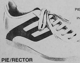
PIE/RECTOR deportivo y la sandalia PIE/RECTOR tienen plantilla incorporada para la continuidad del tratamiento correctivo.