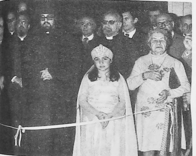
Քաջան արարողութիւնը. ձախէն աջ.՝ Ս. Մարտի 21ին, Միւրաթոնի գեղեցիկ արաւոյ մէջ ցուցադրուեցաւ հայ-միւրաթոնի խոստումը ՄԻՈՅ ԽՈՍՏՈՒՄԸ ժապաւէնը, որ ներկայացուած է Ամերիկայի մէջ եւ որուն գլխաւոր նպատակն էր հայապահպանութեան համար իրականացուած արտադրութեան Մարտի 21ին սկսեալ, տեղի ունեցած ճաշակոյթին ներկայացուած էր: