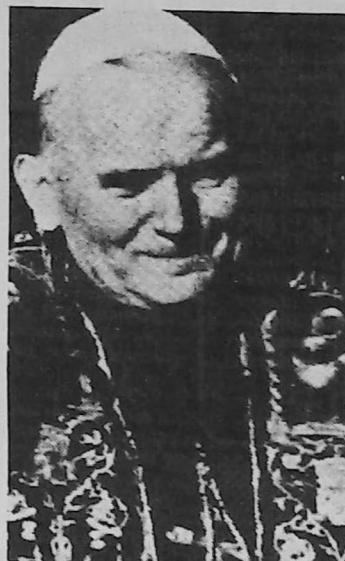
Juan Pablo II

Concretó un viaje espiritualmente fructífero a Irlanda, el Papa Juan Pablo II. En multitudinarias reuniones, realizadas en diversas ciudades de la República Irlandesa, el santo Padre abogó repetidamente por la no violencia y la comprensión entre hermanos, exhortando a la unión de los irlandeses.