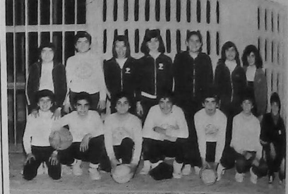
Parte del grupo "ARARAT 80" (1º B.)