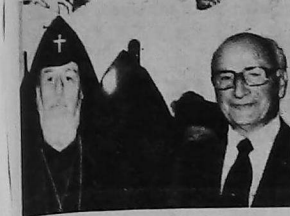
Այս օրերուն ամբողջ Արևիկոյի շայտը իր աշխարհը դարձաւ կողմից զգրի Երևանին, հոգեւին մասնակցելու համար Նորին Սրբութեանց Վեհափառին հանդիսակցութեան։

Չէր կենեք լոյ անձամբ մը կենեքը լաւիցայան երեք, այլ ան լեցուցած Հայ ժողովուրդի ժամանակակից պատմութեանը, անոր ինքնորով ու վրդովեցող, կրքովեցող ու բողբոջակներով։ Մասնաւորաբար Չէր կենեք ինքնին երկու տասնամեակները խորհուրդական համայն Հայութեան հոգեւոր տնօրէնութեան գործին, երբ Չէր շնորհալի անձով բախտաբարեցաւ Սուրբ Գրիգոր Եւստորղի գարաբոր Տէր։ Չէր կենեք ու անուր խոյնացան Սուրբ Էջմիածին Նու. եւ այդ պատմական Աթոռի տարբերութիւնը շարունակելու քաղցր ու լաւ ժամանակ։ Չէր տարեցալարը անմահին։ Եւ իւր, չորսին Չէր հոգեկան գործութեան, ինքնուրու պայծառութեան եւ շինարար կամքի, այդ տարբերութիւնը տարբեր խորհուրդներով ու վեհափառ։ Չեզոք, հաս-