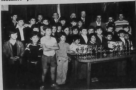
Jugadores que intervinieron en el Torneo de Baby Fútbol.

desarrollo de su actividad. También destacó la actuación de Liga de Jóvenes, quien cooperó ampliamente al éxito de este torneo.