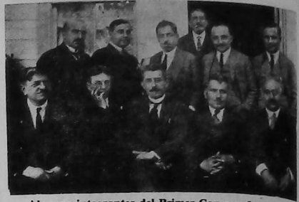
Algunos integrantes del Primer Congreso Internacional de la O.D.L.A. (1922).

Este hito histórico lo conformaban patriotas armenios de Egipto, América, Constantinopla, Esmirna, Adaná y Europa, juntamente con la gran parte de la intelectualidad armenia hasta ese momento no activizada. Así también se fusionaban los Armenagan de Vaspuragan, y de la Armenia Persa, los Unionistas Armenios de los Balcanes, como también los integrantes del Par-