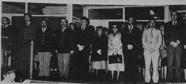
Vista parcial de las autoridades, invitados especiales y directivos de la institución.

El Instituto "Marie Manoogian" de la UGAB rindió homenaje al Padre de la Patria, don José de San Martín y a los caídos en la guerra de las Malvinas, con un emotivo acto que se desarrolló en el Complejo "Alex Manoogian", el lunes 16 de agosto ppdo.