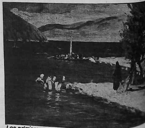
Los primeros peregrinos

En 1919, realiza una exposición en Constantinopla, y