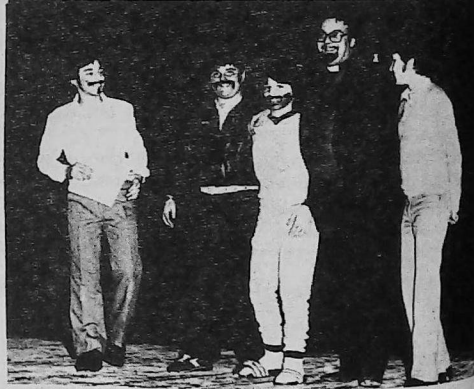
Հոգչ. Գիսակ Վրդ. Մտրաւանի Ս. Գ. Լուսաւորիչ Վարժարանի աշակերտութեան հետ: