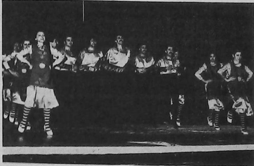
Conjunto de danzas Galané

la celebración del "Día de la Madre", en el salón Centro Armenio.