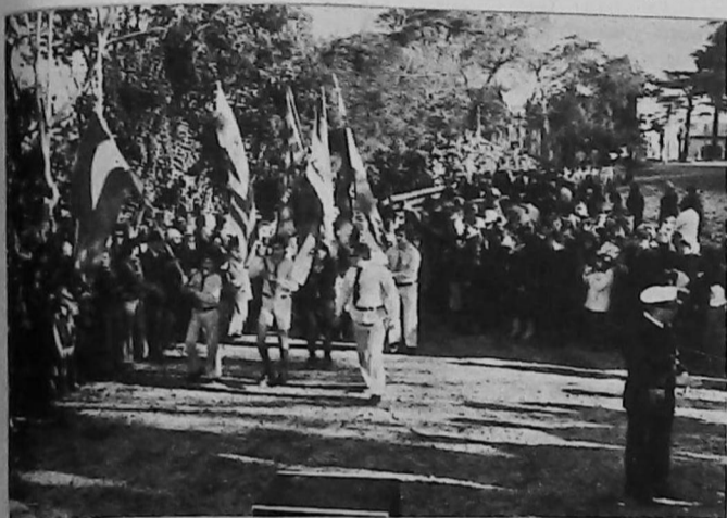
Entrada de Banderas.