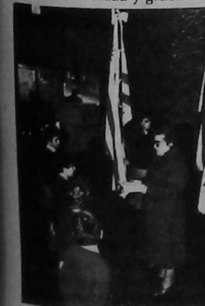
La Sra. Directora toma el juramento a la bandera a los alumnos.

Los alumnos de Primaria cumplieron el programa estipulado con la seriedad y gracia de