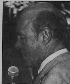
Dr. N. Costa Méndez