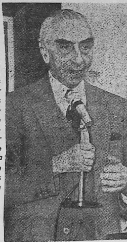
Almirante I. Rojas

"No nos deben faltar medios legales. Pero la voluntad republicana no cuenta menos que la ley."