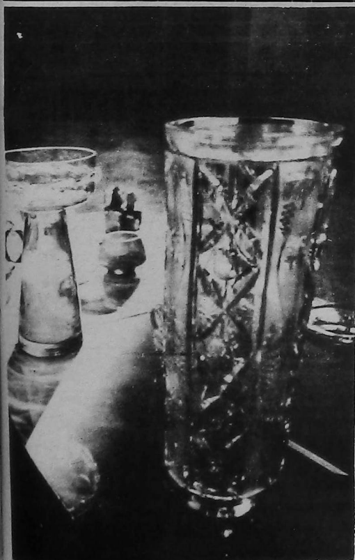
Հայաստանեան Արքայկերտ Մարտիկի Միջազգային յայնացակեայ իրեր, ցուցանանդէսին մէջ