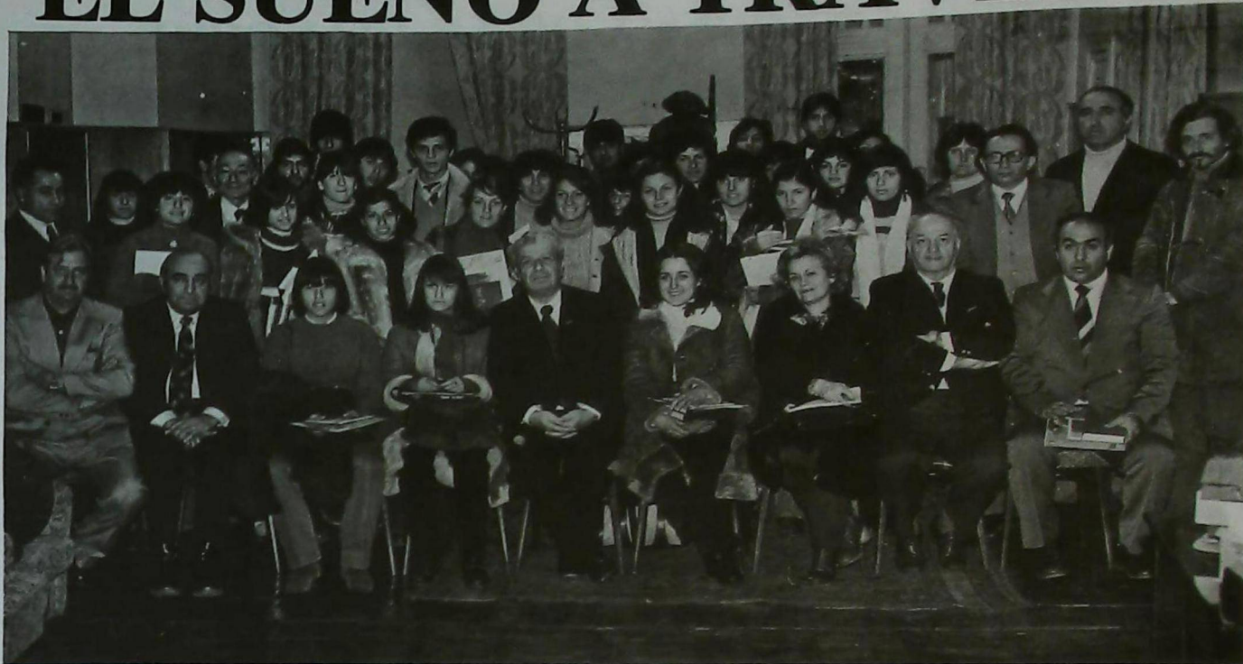
Los alumnos del "Marie Manoogian" Y "San Gregorio" junto a la comisión directiva del Comité de Relaciones Culturales para la diáspora.