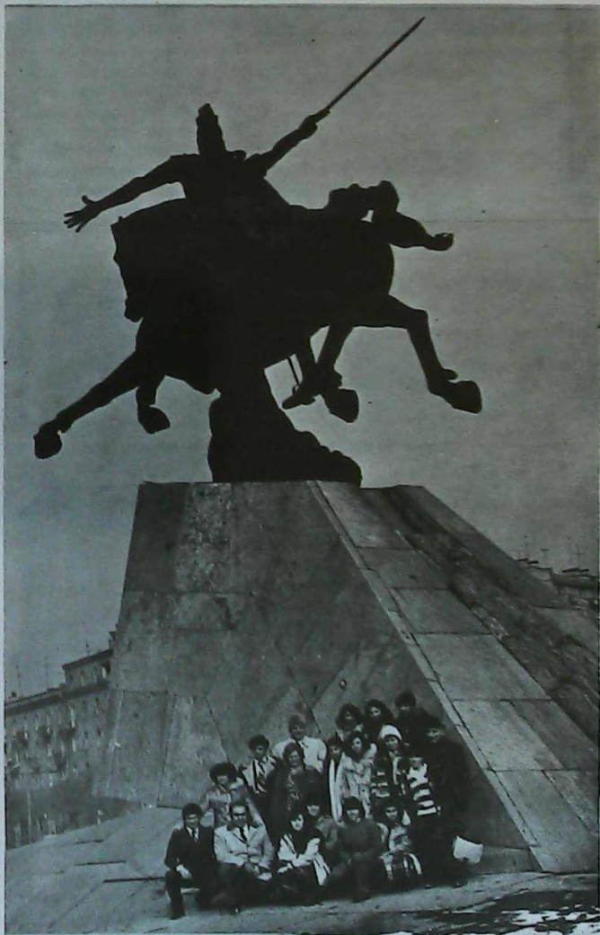
Los alumnos del Marie Manoogian viven la historia armenia junto al monumento de Sasuntzi Tavit.

Մարի Մանուկեան Կրթ- Հաստատութեան եւ Ս. Գրիգոր Լուսաւորիչ Կրթ. Հաստատութեան աշակերտները նկար- ուած Սփիւռքահայու- թեան Հետ Մշակութա- յին Կապի Կոմիտէի ղե- կավարութեան եւ Հայ- րենիքի Ձայնի խմբագ- րական կազմի հետ, 3 Յունուար 1980.-