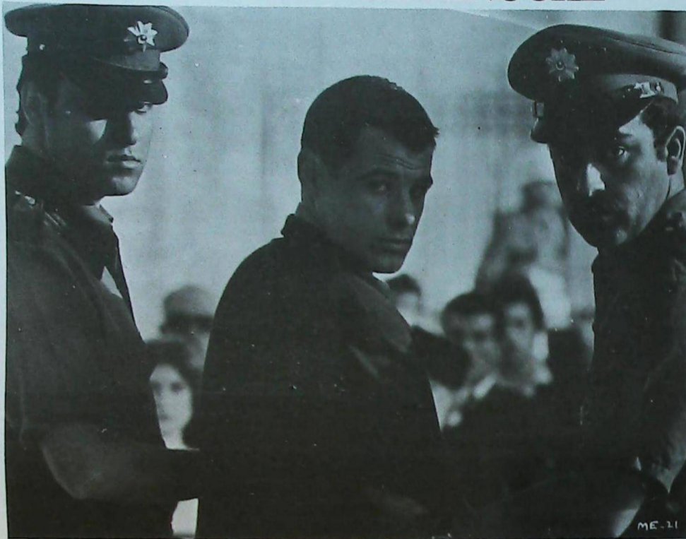
Escena del primer juicio.

Tremenda, sádica, escalofriante. Pero reveladora de una manera de ser: la más inhumana, la más salvaje. Se desarrolla en las prisiones turcas contemporáneas y, como dijera César Magrini en "El Cronista Comercial", "la historia es ácida, lacerante, cruel, y por desgracia, cierta".