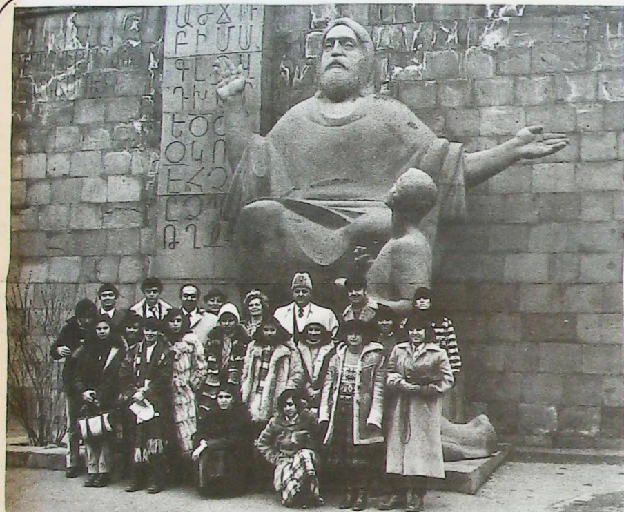
● Ա.Բ.Գ... այս էր Ս. Մետրոպ Մաշտոցի պատգամը՝ ծուկի եկած իր առաջին աշակերտին: Եւ Մարի Մանուկեան Կրթական Հաստատութեան աշակերտները, անվերապահօրէն չէին կրնար շրջանցել հայ գիրքը հնարողի պատգամը:

Սարտաբազատ կրկին անգամ կը շնորհաւորէ մեծ գիտնականը եւ նորանոր յաջողութիւններ կը մաղթէ իրեն: