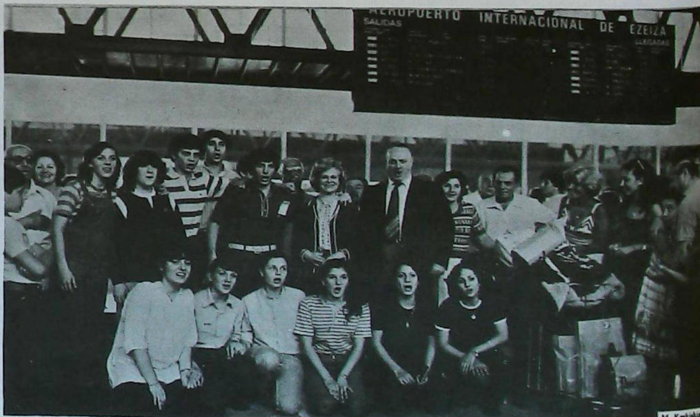
Sábado 19 de 1980: el regreso del grupo Marie Manoogian, en el aeropuerto de Ezeiza. Al día siguiente arribó a Ezeiza el grupo de San Gregorio.

Հ.Բ.Ը.Միութեան աշակերտները, երուանդ Քոչարի վերջին ստեղծագործութիւնը հանդի- սացող, Վարդան Մամիկոնեանի յուշարձանին առաջ. 4 Յունուար 1980.-